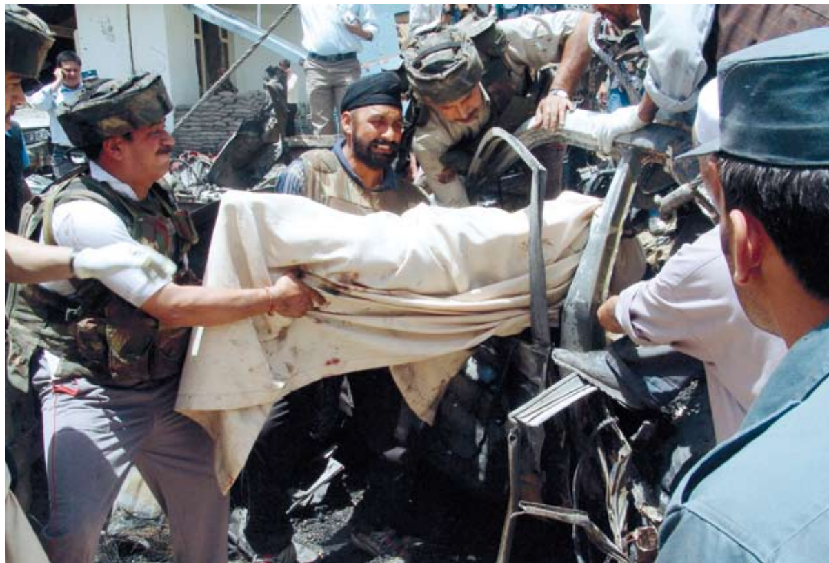
Na een zelfmoordaanslag bij de Indiase ambassade in Kabul wordt geprobeerd een lichaam van een auto te halen. Ruim 40 mensen werden gedood.