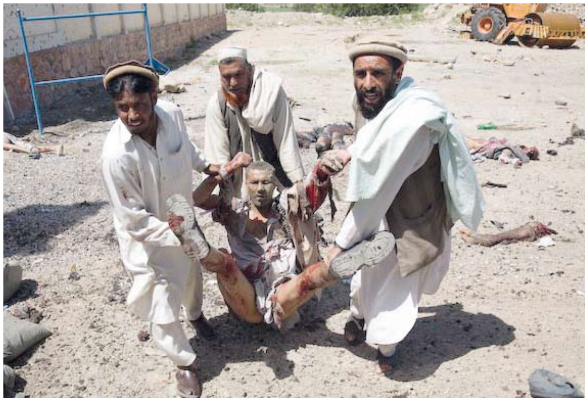
Slachtoffers van een Taliban-aanslag op een politiebureau in de provincie Nangarhar.