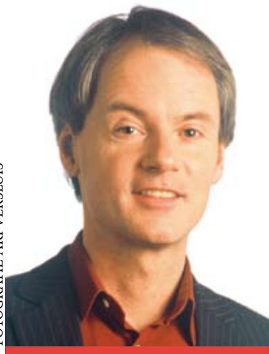
SP-KAMERLID HARRY VAN BOMMEL