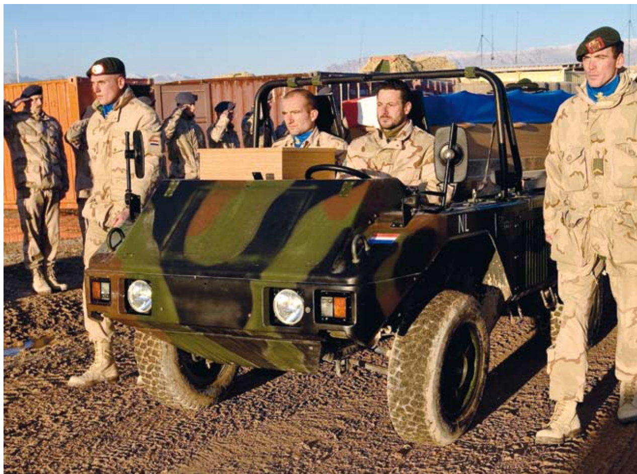
De ceremonie bij het vertrek van het vliegtuig met de lichamen van twee omgekomen Nederlandse militairen.