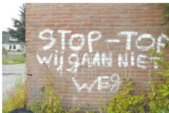
De boodschap van de bewoners aan de terreineigenaar en aan de gemeente is duidelijk: liever hier gebrekkig bivakkeren dan creperen op straat.