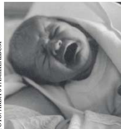
Arda liet zich in 1965 voor het eerst horen.

Met het Europees voetbalkampioenschap, Wimbledon, de Tour de France en de Olympische Spelen kon de sportliefhebber afgelopen zomer zijn hart ophalen. Ook Tweede Kamerleden van de SP genoten met volle teugen. Welke prestatie maakte de meeste indruk?