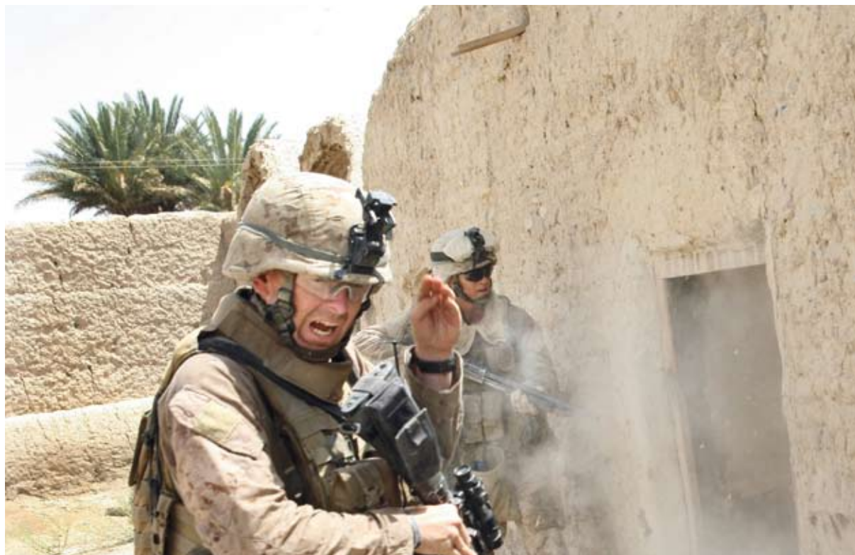
Amerikaanse mariniers blazen een deurslot op tijdens een offensief in Garmisir.