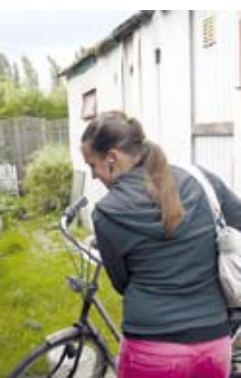
n Havo 4 en wil Ze laat zich niet kisten wonen op Nooit en het stigma bestand en internaat terecht

TEKST: ANTHONIE VERMEER