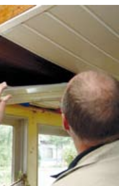
e Hans van Leeuwen d dat bij fikse regenbuien