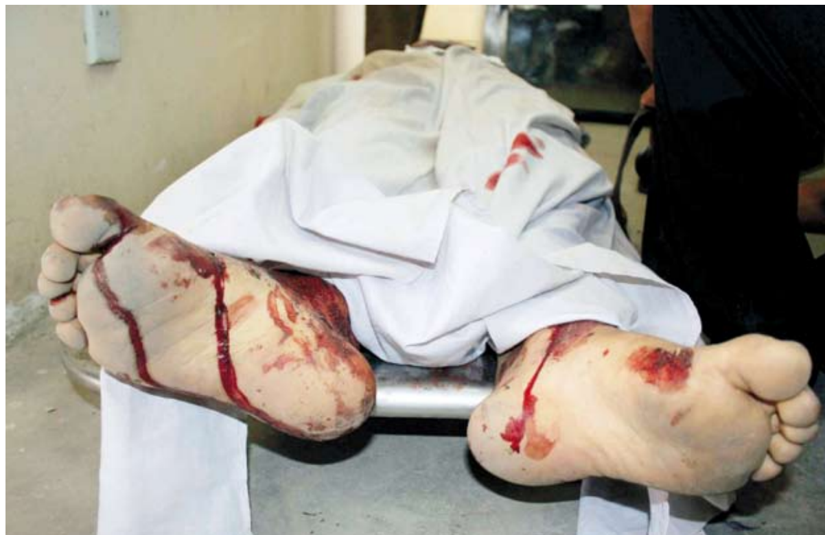
Mortuarium in Kabul: de voeten van het slachtoffer van een bomaanslag.