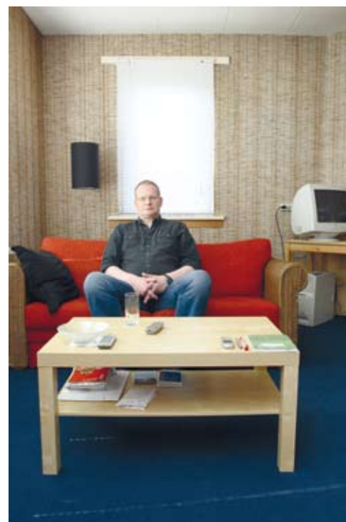
Anonieme bewoner: "Lang denk je dat dit tijdelijk is. Dus richt je niet in"