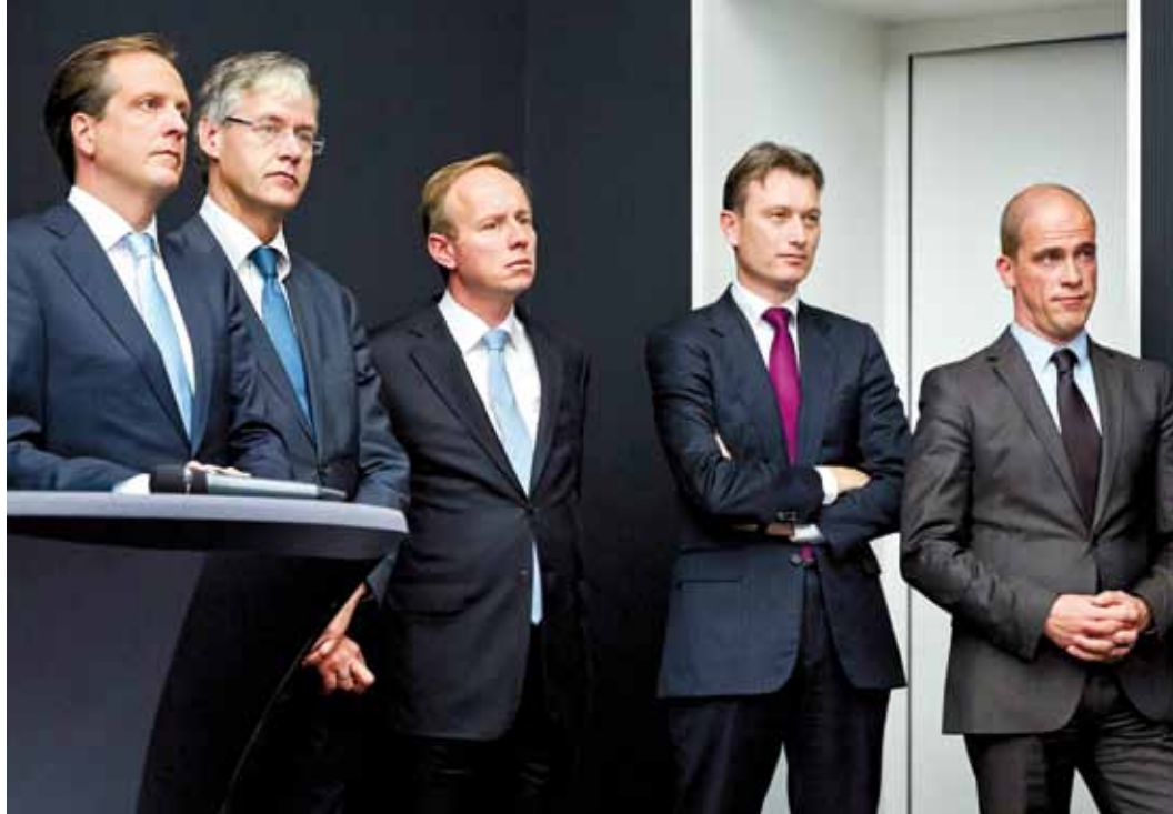
Fractievoorzitters Pechtold (D66), Slob (ChristenUnie), Van Der Staaij (SGP), Zijlstra (VVD) en Samsom (PvdA) na afsluiting van het Financieel Akkoord, waarmee Emile Roemer niets te maken wil hebben

Het heeft er alle schijn van dat de omslag aanstaande is. De grote opkomst in september bij de demonstratie Basta! in Amsterdam geeft de burger moed. De boosheid onder de mensen nadert het kookpunt: de boosheid over de afbraak van wat ons land beschaafd maakte; het wegsijpelen van de solidariteit; de arrogantie van de macht. Okay, het mag hier allemaal wat langer duren: maar ten lange leste geldt ook voor de Nederlanders dat de kruik net zo lang te water gaat tot 'ie barst. Gelukkig maar. De dagen van het kabinet Rutte – Samsom zijn geteld.