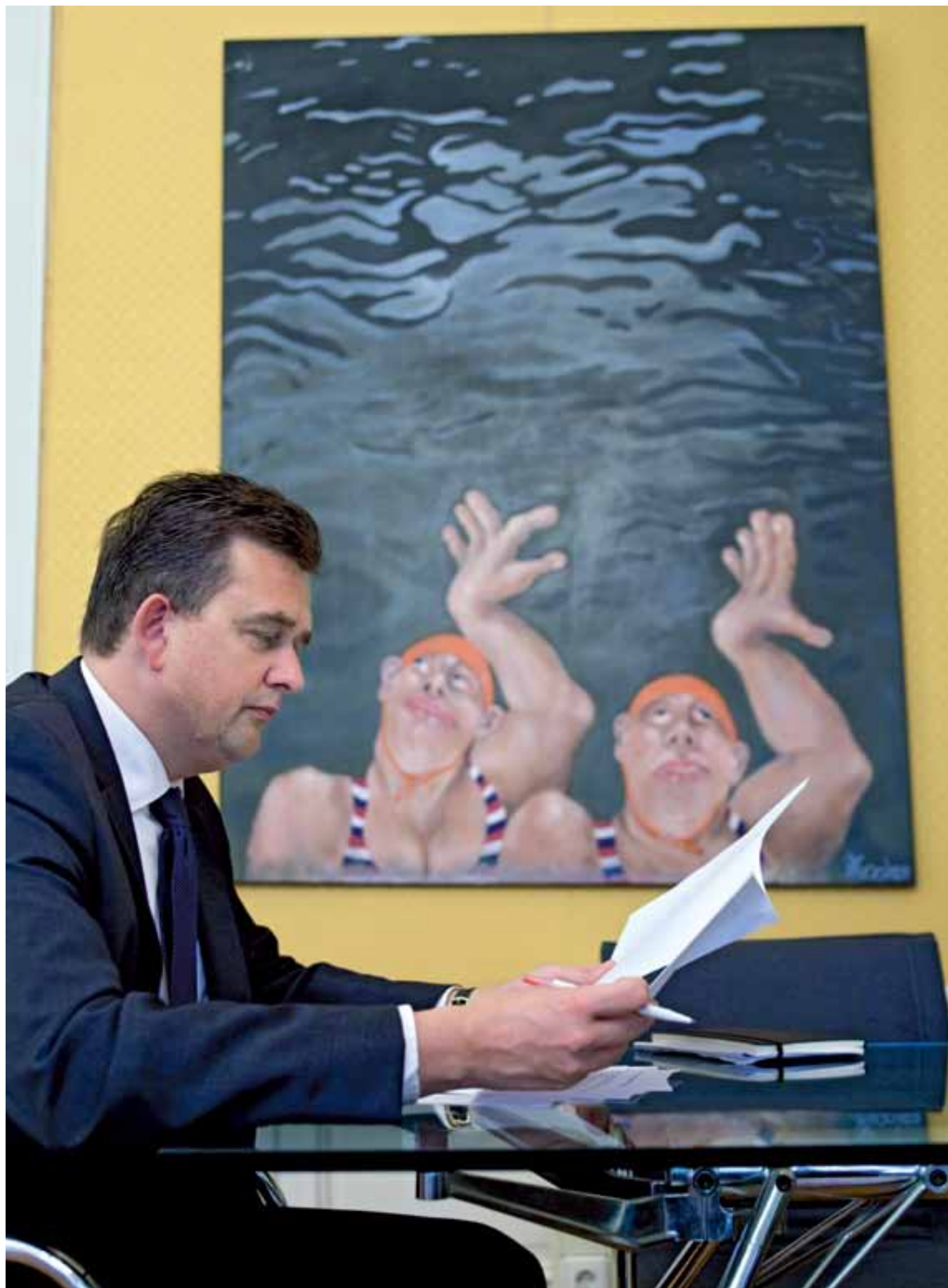
'Wij zullen steeds weer optimisme en hoop bieden als alternatief voor het rechtse pessimisme en wantrouwen.'