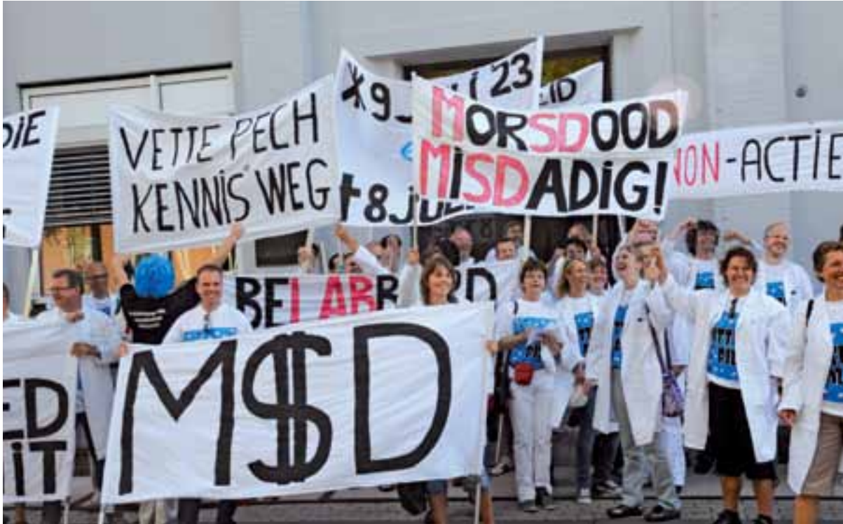
Het personeel van Organon laat zich niet zomaar naar de slachtbank leiden.