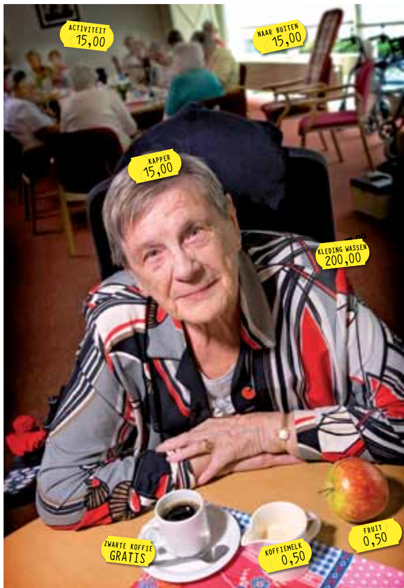
Er hangen prijskaartjes aan dagelijkse zorg die eigenlijk al betaald is.

Ouderen en gehandicapten die in verzorgings- en verpleeghuizen en in gehandicapteninstellingen wonen, blijken onterecht allerlei rekeningen te krijgen. Zo moeten zij betalen voor douchen, vrijwilligerswerk en fruit. Gewone zorg wordt zo een luxe, alleen bereikbaar voor mensen die het kunnen betalen.