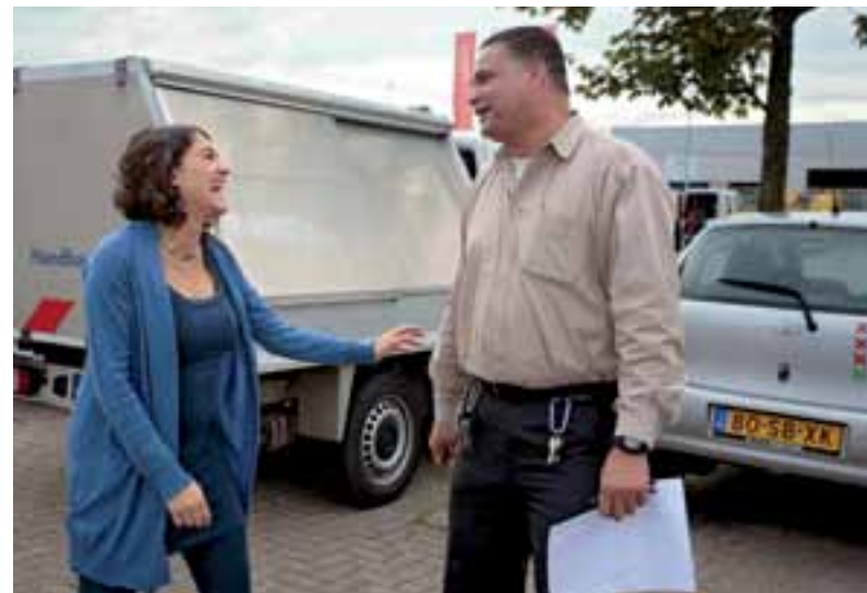
Sadet ontmoet een oud-collega van de gemeente Amsterdam.

droegen verantwoordelijkheden en vergaten daarbij hun achtergronden en verschillen van etniciteit, nationaliteit, sociale afkomst, of wat dan ook. Omdat het er uiteindelijk om ging dat ze elkaar nodig hadden om hun idealen voor elkaar krijgen. Raad eens op welke datum ik ben afgestudeerd? 11 september 2001. Op weg naar huis hoorden we over de aanslagen in New York. Ik was onthutst, maar ben door die gebeurtenis niet anders gaan denken of leven. Maar ik baal ervan dat sindsdien denken in tegenstel-