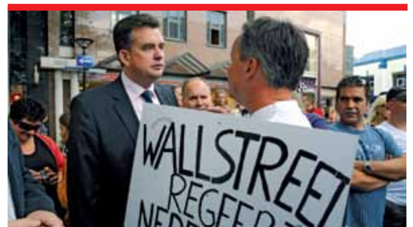
Emile Roemer steekt demonstranten een hart onder riem.