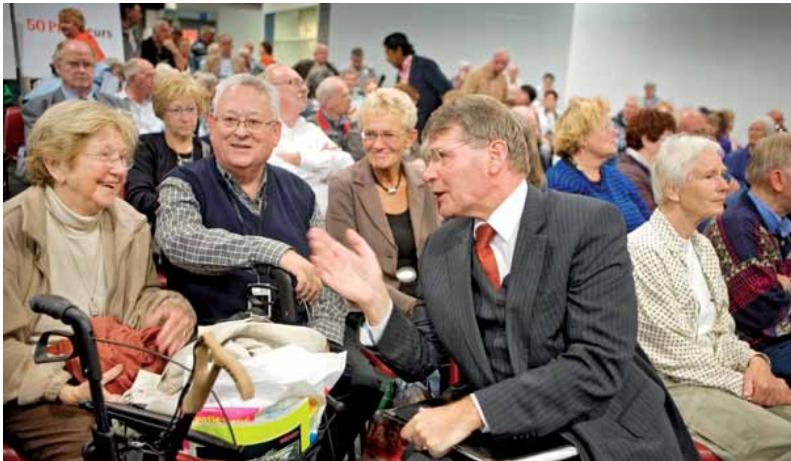
50 Plus Beurs van 2007: toen van pensioenroof nog geen sprake was kreeg minister Donner de mensen nog wel eens aan het lachen.