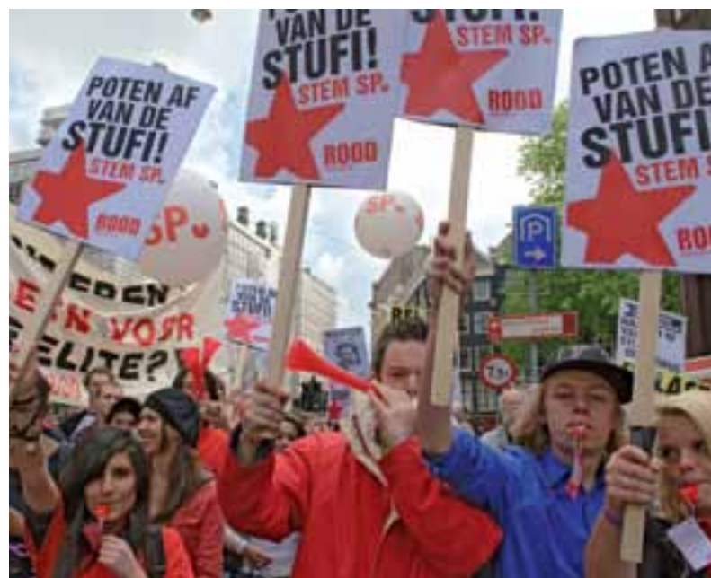
ROOD-jongeren verzetten zich luidruchtig tegen de afschaffing van de studiefinanciering in Amsterdam.

'Ik krijg zelf geen studiefinanciering meer omdat dit mijn 6de jaar