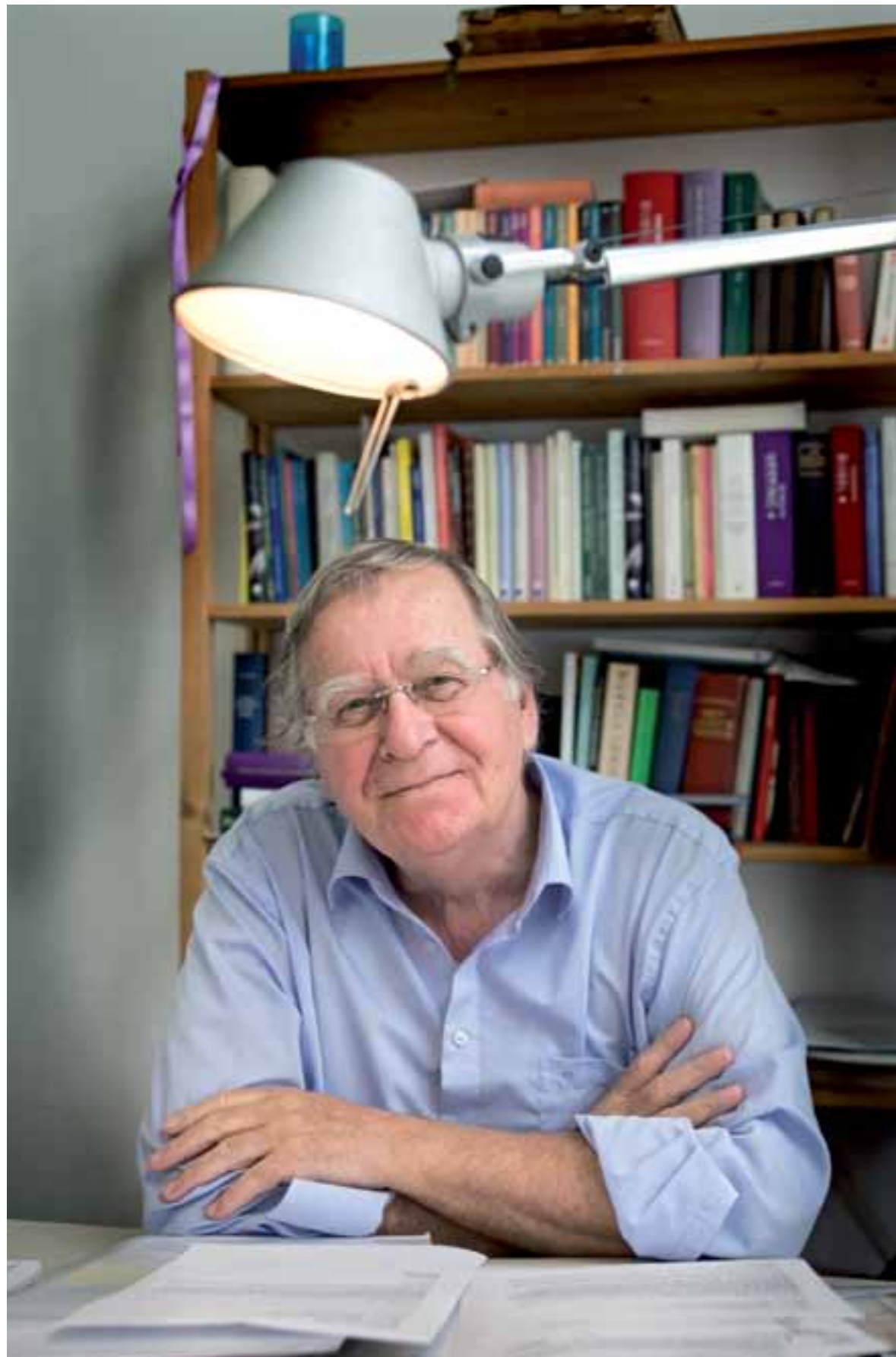
Huub: 'Ik haat patserig gedoe, de het-beste-dit-en-beste-dat-cultuur. Met de bonuscultuur als meest doorgeslagen variant.'

Huub Oosterhuis (76) is theoloog, dichter en voormalig priester. Hij werd beroemd na zijn verwijdering uit de Rooms katholieke kerk. De excommunicatie was zijn 'straf' voor het zoeken naar eigentijdse en maatschappelijk bruikbare interpretaties van de christelijke tradities. Daarmee is hij nooit opgehouden.