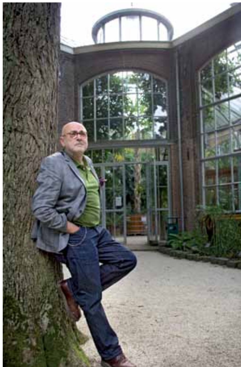
Tijdrovend was zijn gevecht voor het behoud van het Wibauthuis: 'Het is vreselijk hoe lelijk ze Amsterdam maken. Allemaal zo Anton Pieck-achtig, veilig, truttig.'

personage houden en dan valt een afwijzing zwaar tegen. Teksten voor film- en tv-rollen leren kost veel tijd. Bij toneel is dat minder, want tijdens een maand repeteren valt de tekst logisch op zijn plek.