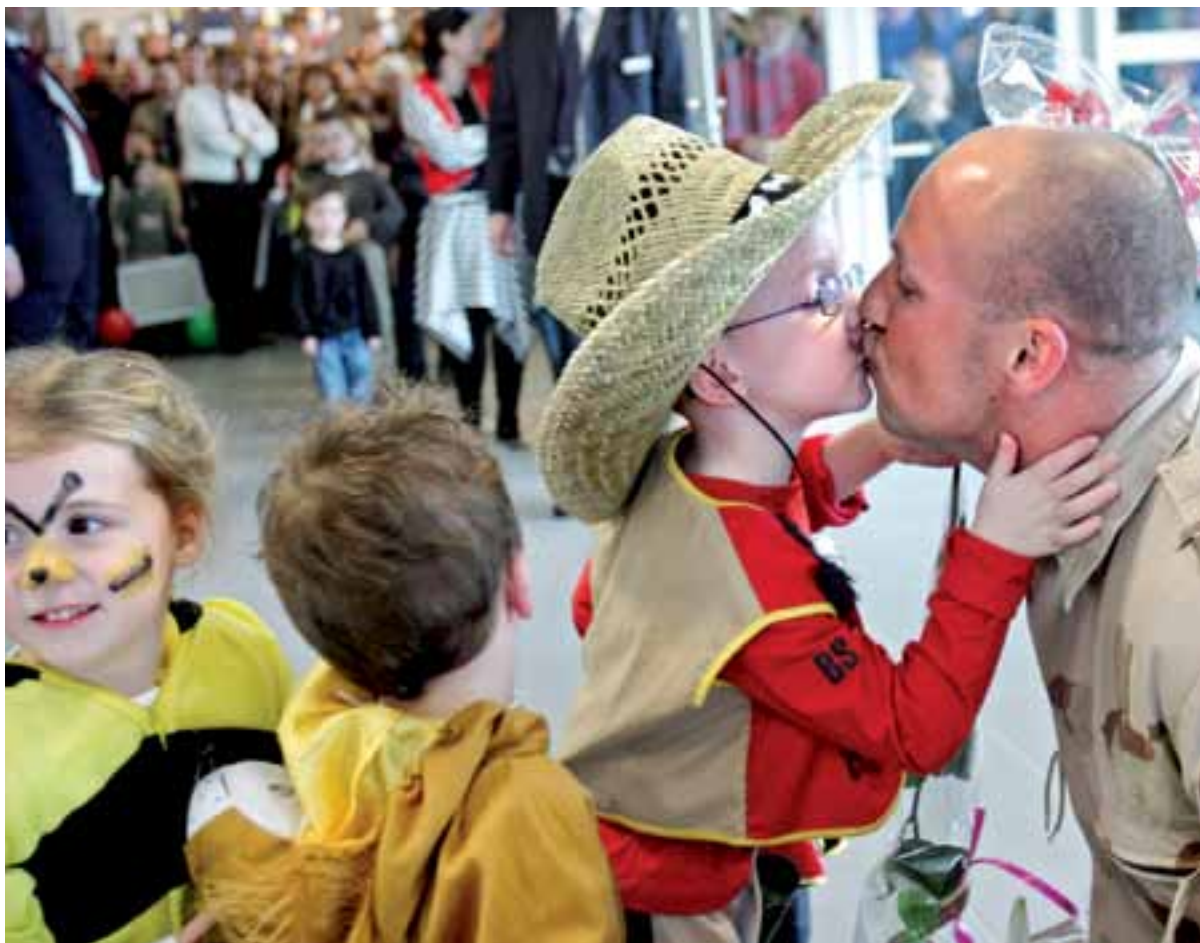
Een uitgezonden vader wordt feestelijk verwelkomd op het vliegveld van Eindhoven na zijn terugkeer uit Afghanistan.

Nu de Nederlandse militairen zich terugtrekken uit Afghanistan, is het tijd de balans op te maken. SP-Tweede Kamerlid Harry van Bommel ziet één enkel plusje, maar een trits minpunten. 'Al Qaida is niet uitgeschakeld en de Taliban maken in grote delen van het land de dienst uit.'