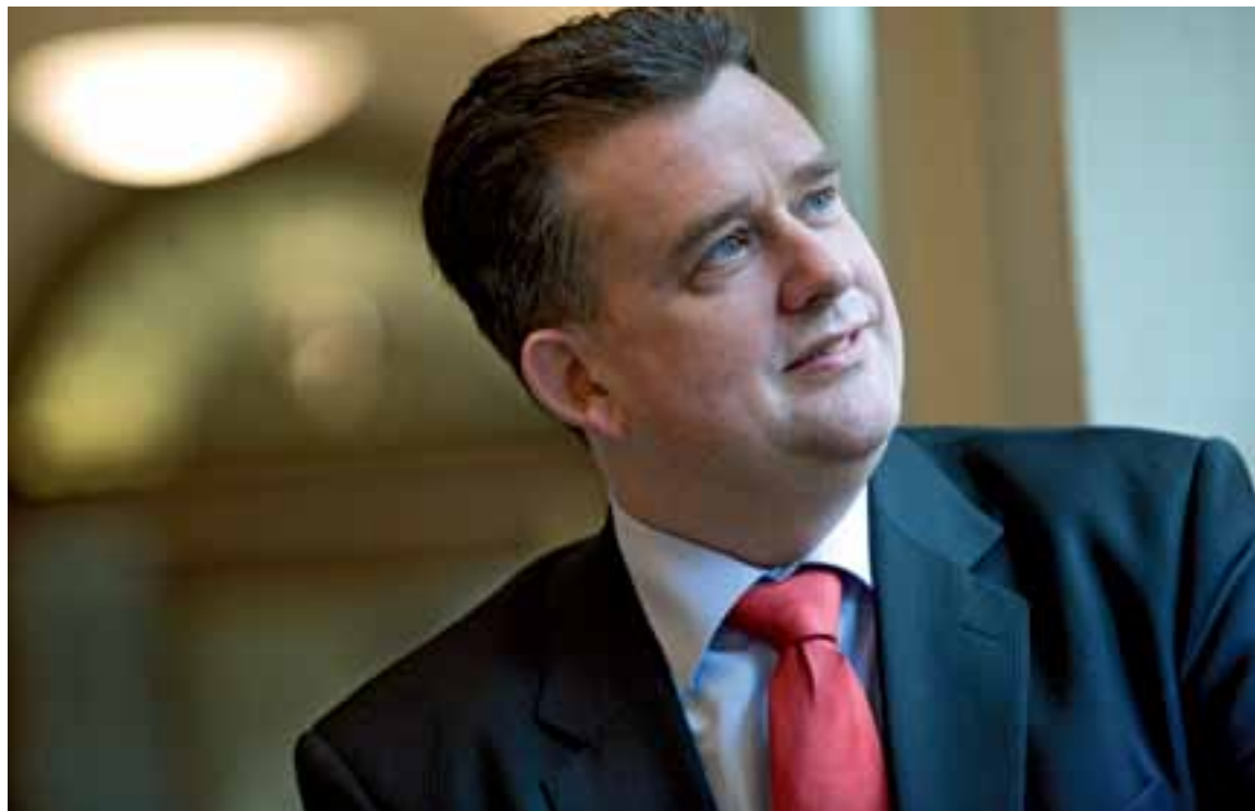
'We kunnen kapitalen besparen door een einde te maken aan onnodige bureaucratie.'