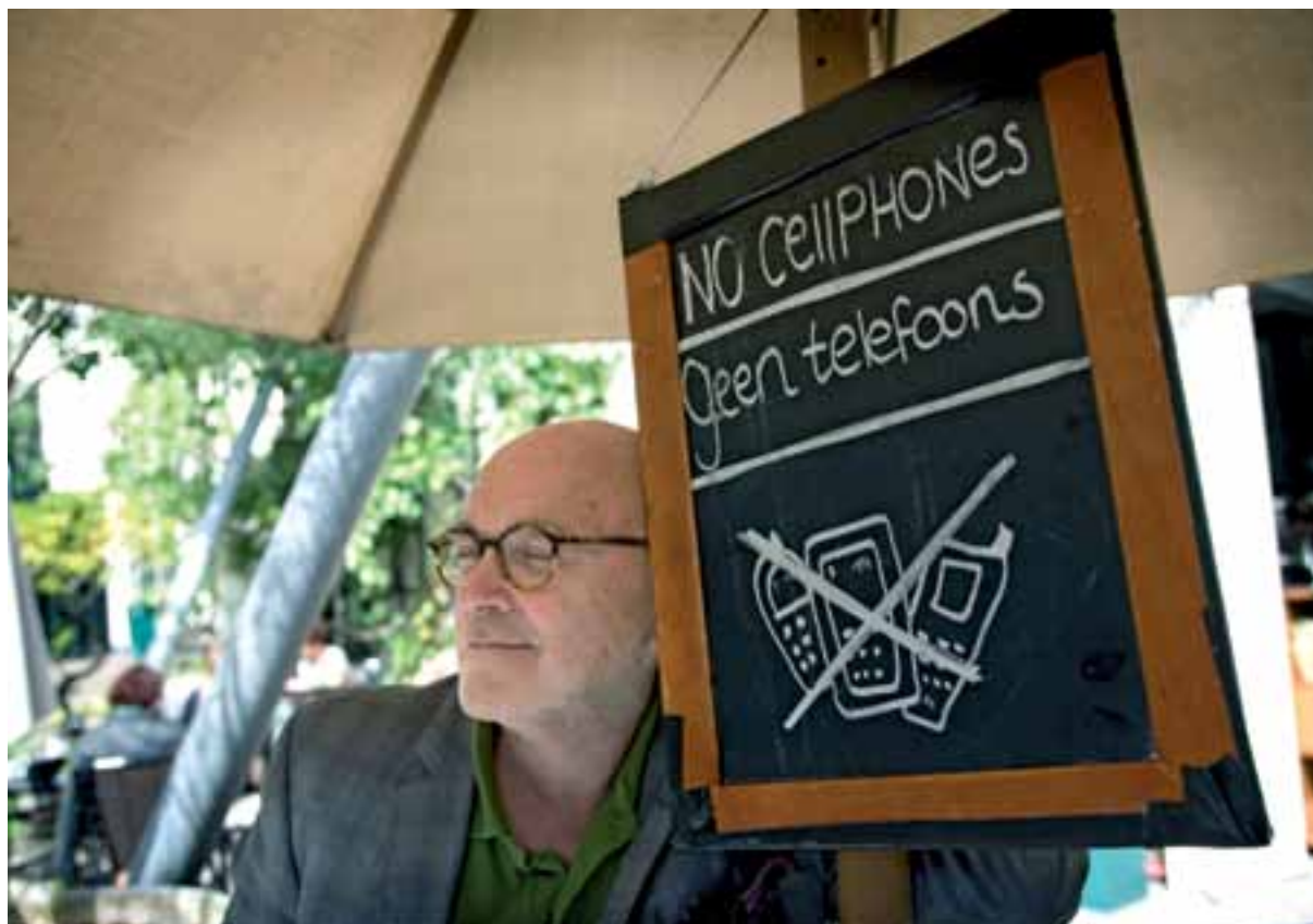
'Nieuwe media, ik heb er niet zoveel mee.' Dus blij met het gsm-verbod op het terras van de Hortus Botanicus.