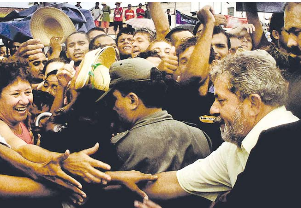
het stadje Sobral tijdens de Fome Zero Campagne