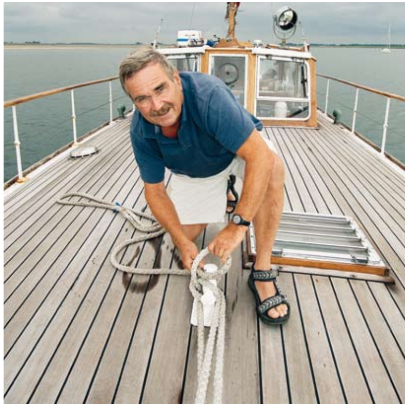
Op Zeeuwse wateren laadt Remi zich op voor de strijd om een betere maatschappij.

TEKST: BERT VOSKUIL