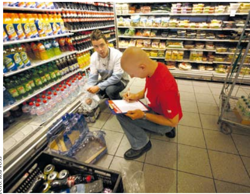
SP-jongeren inventariseren misstanden onder jeugdig personeel.

TEKST: DANIËL PETERS