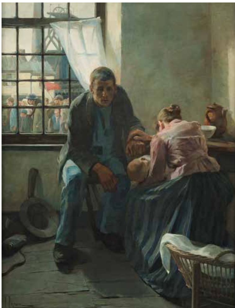
Lucien Lejeune: Misère .