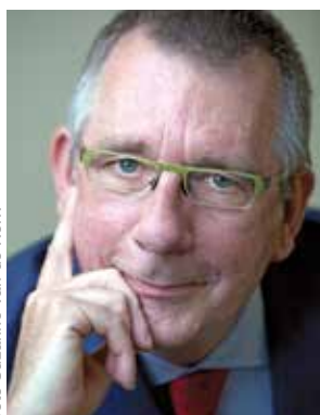
Dennis de Jong SP-fractievoorzitter Europees Parlement