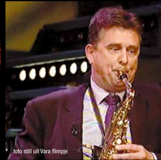
foto still uit Vara filmpje

Bedankt voor al die keren, schouder aan schouder met de mensen