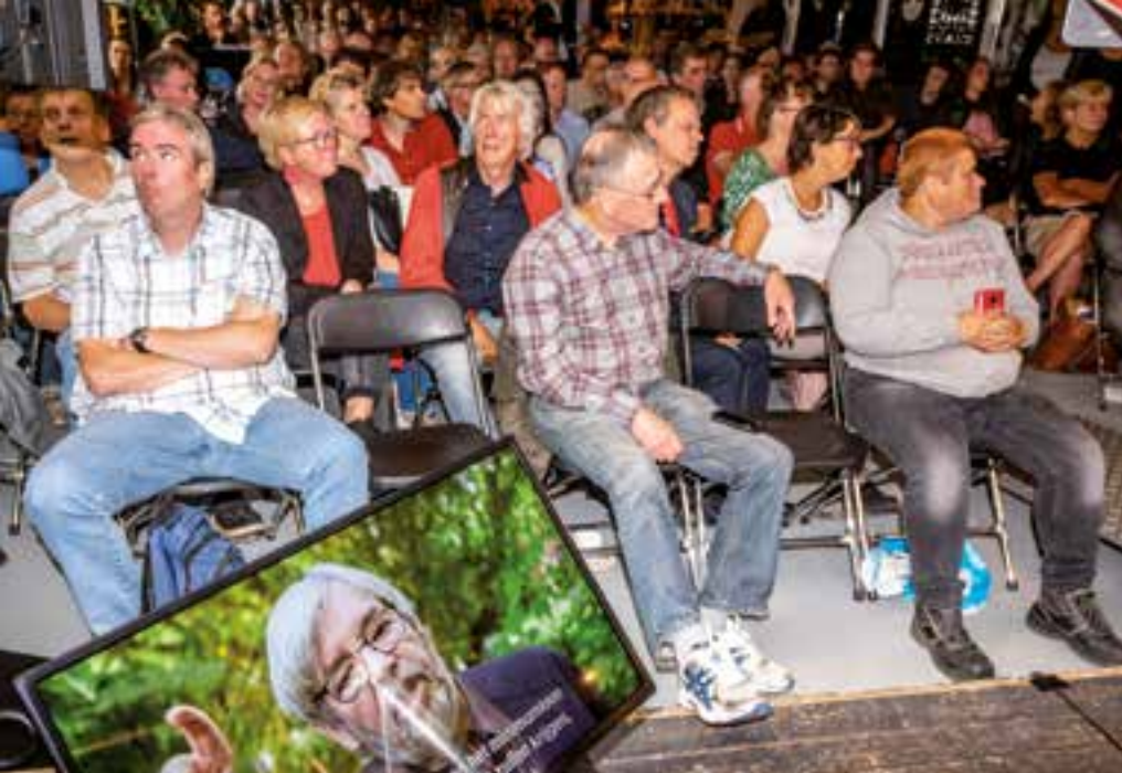
Volle bak in De Prael.