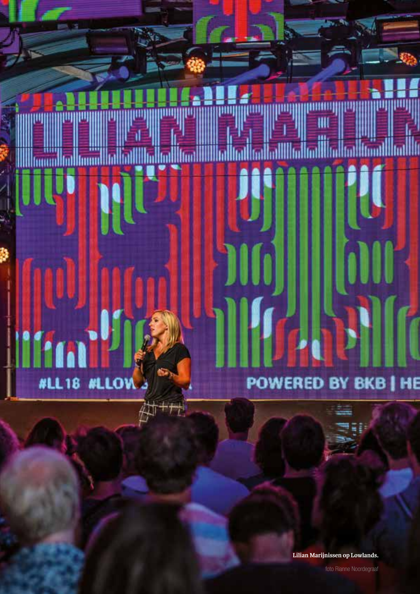
Lilian Marijnissen op Lowlands.