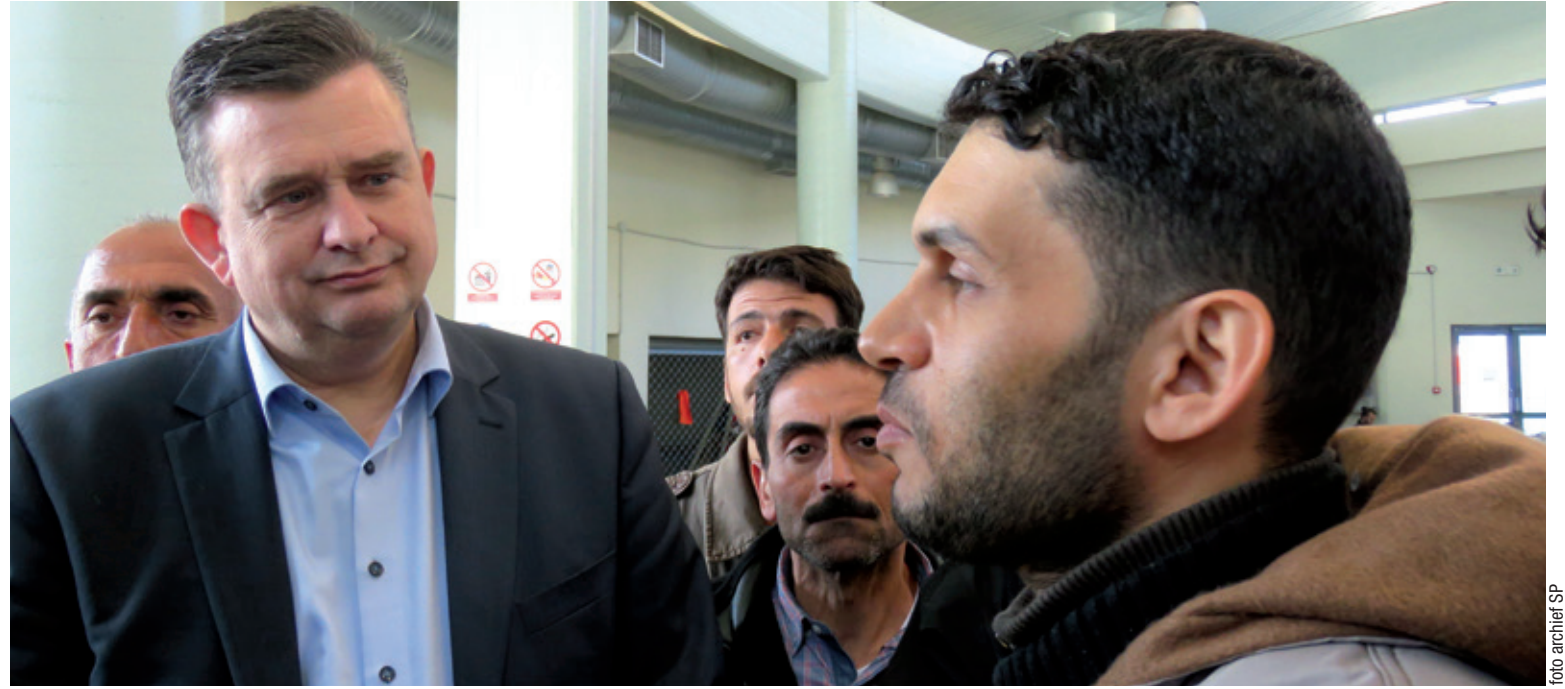
Emile Roemer spreekt in Griekenland met vluchtelingen.

kies ervoor dat mensen zo snel mogelijk integreren. En maak vluchtelingen duidelijk dat ze nu recht op opvang hebben, maar ook recht op terugkeer als de oorlog voorbij is. Velen willen dat ook. Syrië ligt in puin, ze hebben straks de mensen hard nodig om de boel weer op te bouwen. Tegelijk zullen wij Nederlanders duidelijk maken dat de pijlen op het afbraakbeleid van Rutte moeten worden gericht en niet op de slachtoffers van oorlog.'