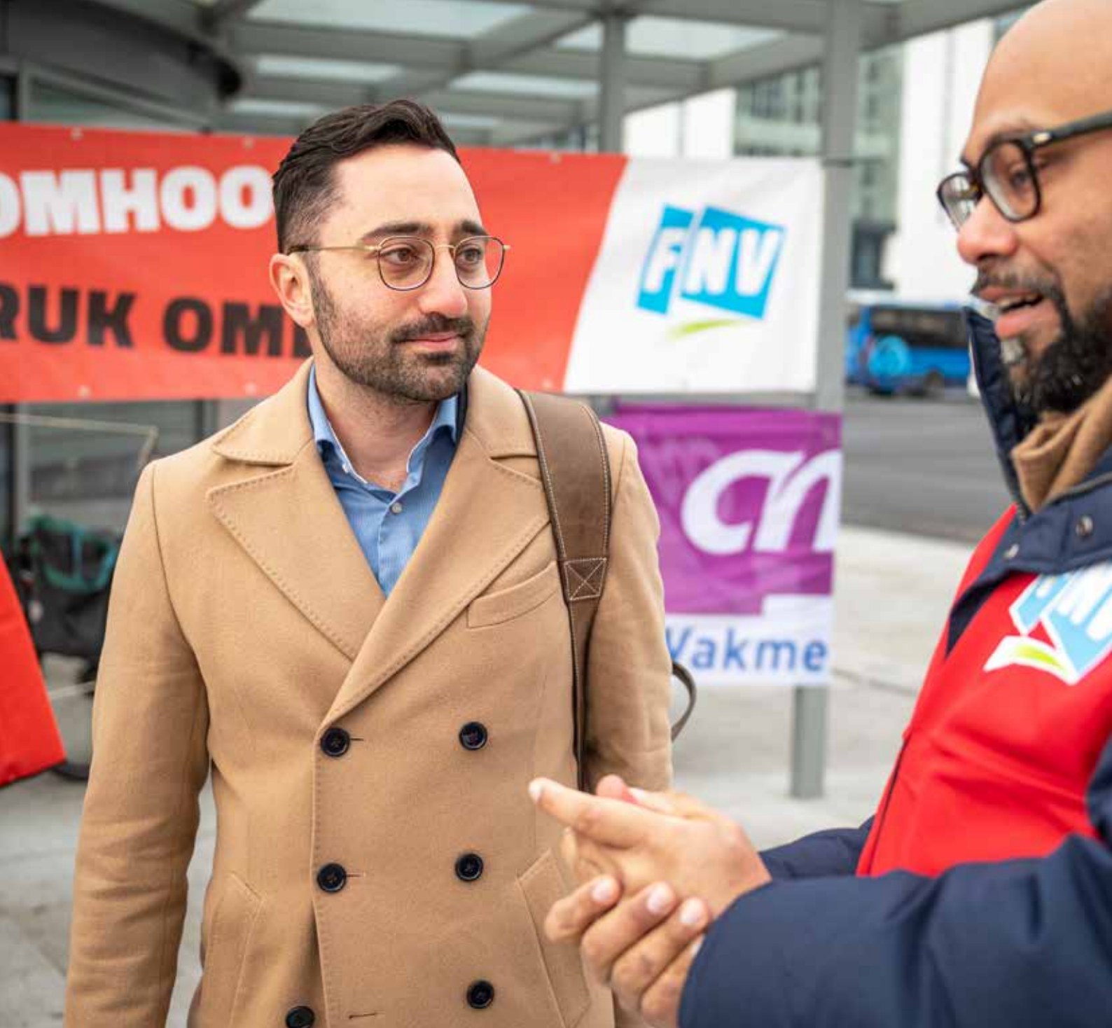
Op bezoek bij een OV-staking in februari.