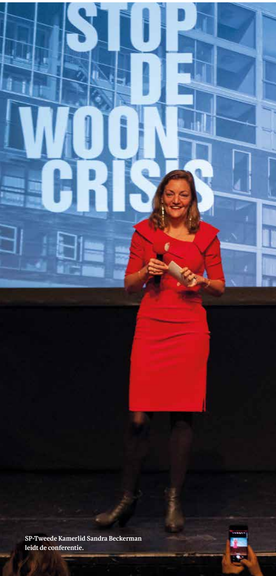
SP-Tweede Kamerlid Sandra Beckerman leidt de conferentie.