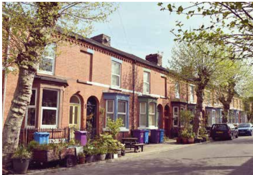
Liverpool: wat gebeurt er als mensen zélf over hun buurt gaan?

Dat het ook anders kan, blijkt uit het woonoffensief dat in Wenen is gestart. Daar zijn het afgelopen jaar ruim 10.000 sociale huurwoningen gebouwd en is 150 miljoen geïnvesteerd in het opknappen en verduurzamen van woningen. ‘Bovendien mag je daar in een sociale huurwoning wonen met een inkomen tot zo’n 66.000 euro netto per jaar. Dat zorgt voor goede en gemengde wijken’, aldus Lilian Marijnissen.