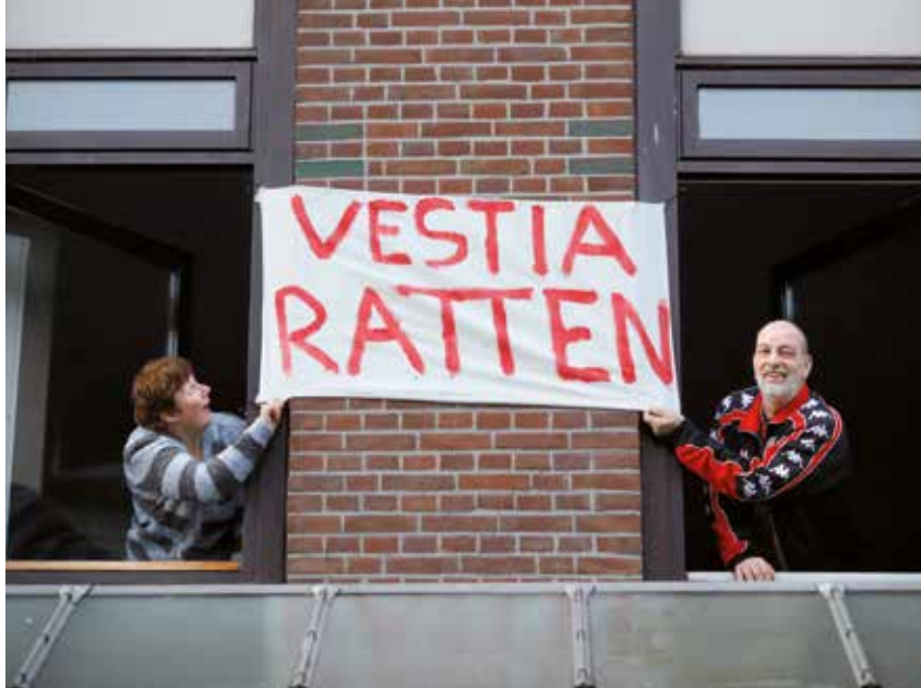
De bewoners nemen op zijn Rotterdams geen blad voor de mond.