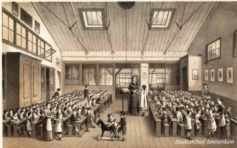
Een klas kon al snel uit 100 kinderen bestaan, met maar enkele leidsters.

In veel Europese landen kreeg de kinderopvang een belangrijke rol tijdens de Eerste Wereldoorlog. Kinderen konden naar de opvang bij de fabriek, zodat moeders daar konden werken om bijvoorbeeld munitie te maken. Nederland (en