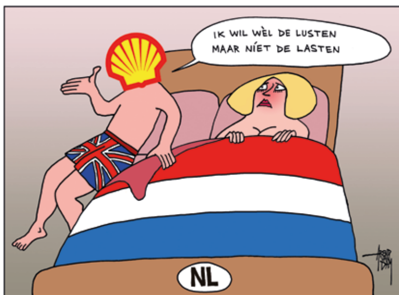
Shell verlaat Nederland vanwege dividendbelasting