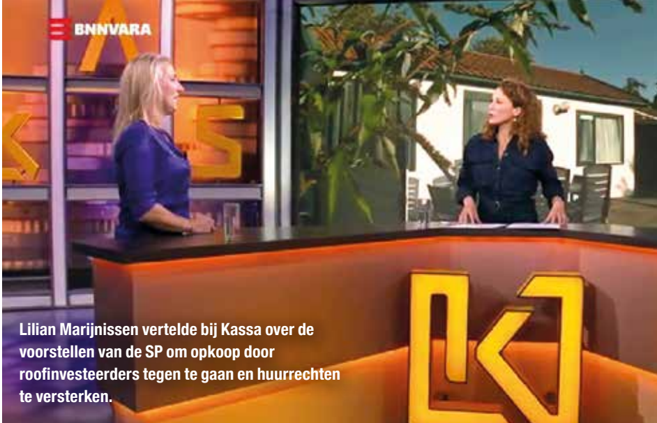
Lilian Marijnissen vertelde bij Kassa over de voorstellen van de SP om opkoop door roofinvesteers tegen te gaan en huurrechten te versterken.