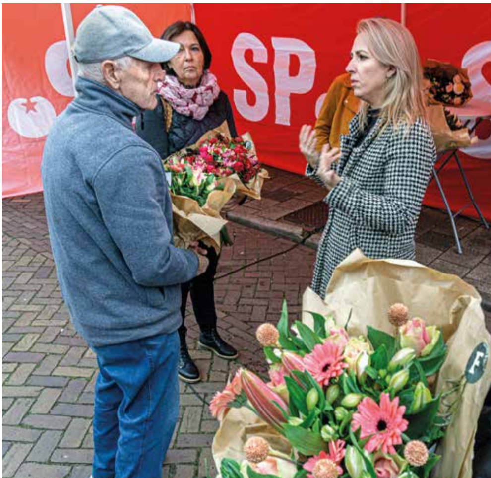
Het weekend voor de verkiezingen was Lilian Marijnissen met een flink aantal partijgenoten in beide Oost-Brabantse gemeenten: Superzaterdag!

Het weer zat niet mee op het festival – passend bij de trieste ervaringen van mensen in het zwartboek. De regen zorgde dan wel weer voor een vrolijke zee van rode SP- en FNV-paraplu's. De wethouder zegde op het podium gesprekken toe met mensen die door de gemeente in de problemen zijn geraakt. Een eerste zonnestraaltje van hoop? •