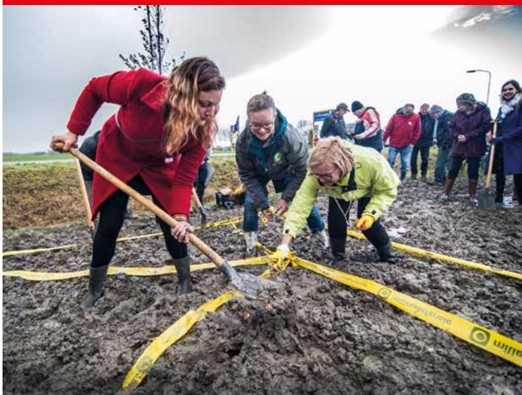
'Bloeiend verzet': SP-Kamerlid Sandra Beckerman plant samen met de Groningers bloembollen tegen de gaswinning (11 november 2017).

Kapitalisme zou een goede politiek zijn omdat die zou aansluiten bij de menselijke natuur. Was het immers niet Charles Darwin die aantoonde dat het leven een survival of the fittest is, waarbij de sterksten overleven? Daarom zou het goed zijn om op de markt alle ruimte te laten aan de rijken. Liberalen doen soms een beroep op Darwin, maar hebben van diens filosofie weinig begrepen. Met 'sterkste' (fittest) bedoelde deze bioloog niet het individu maar de soort. De mensheid kan alleen overleven als we samen in staat zijn tot aanpassing aan veranderende omstandigheden.