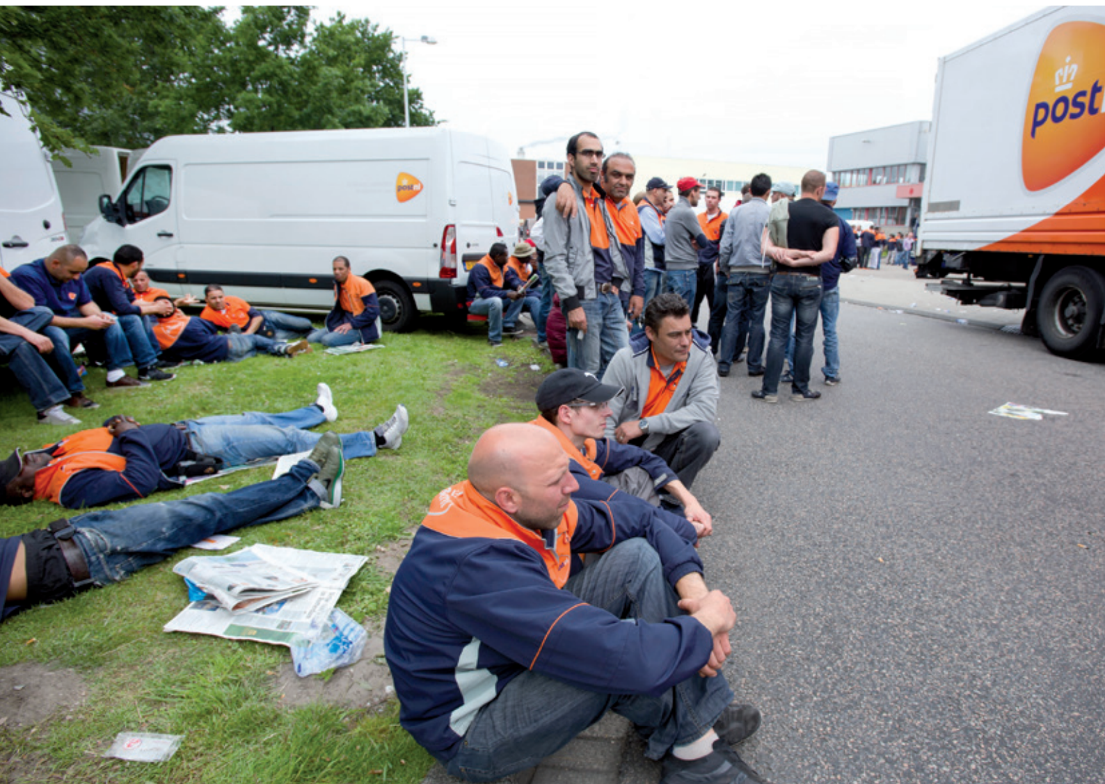
Stakende zzp-bezorgers zitten (niet) bij de pakken neer.