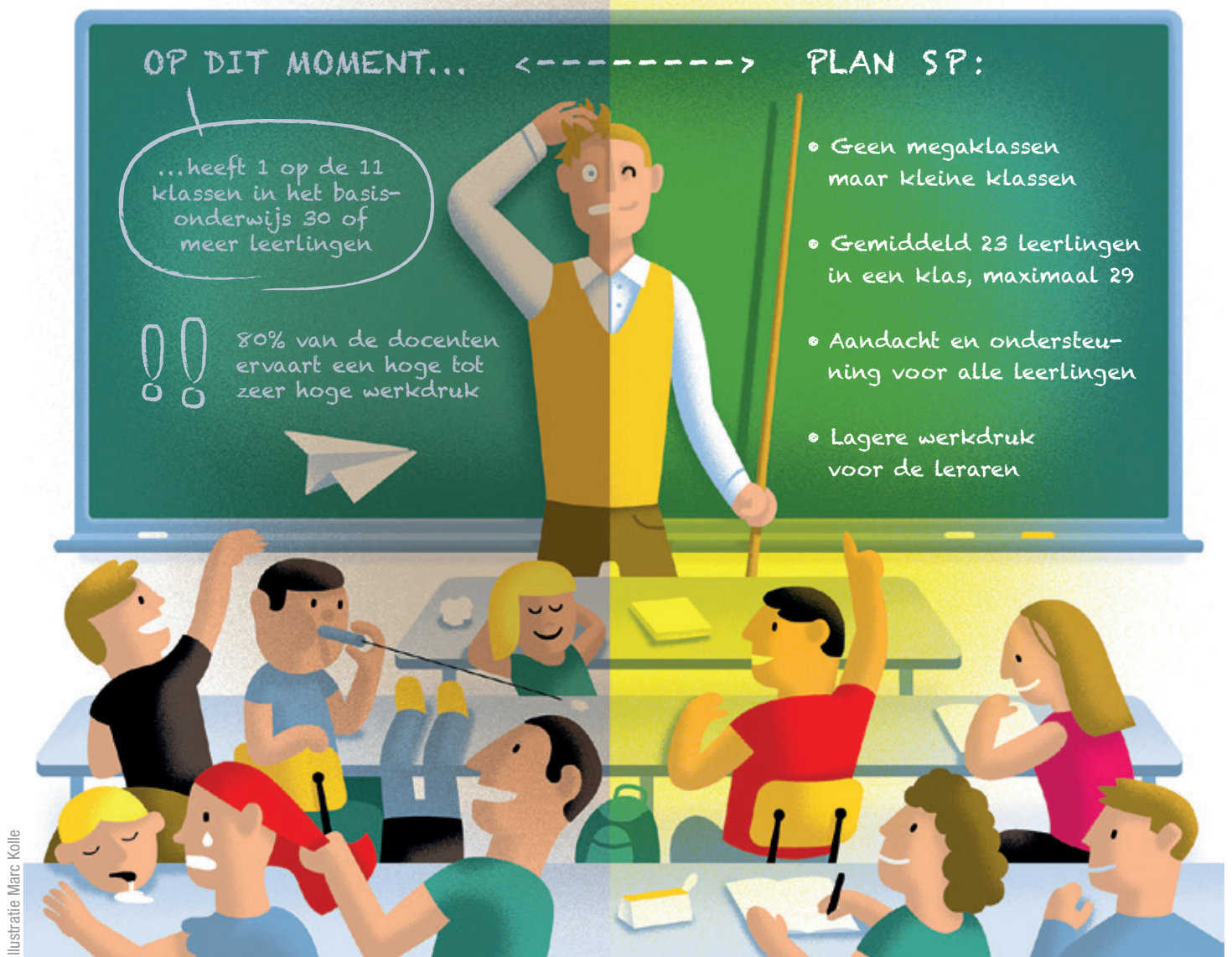
Illustratie Marc Kollé