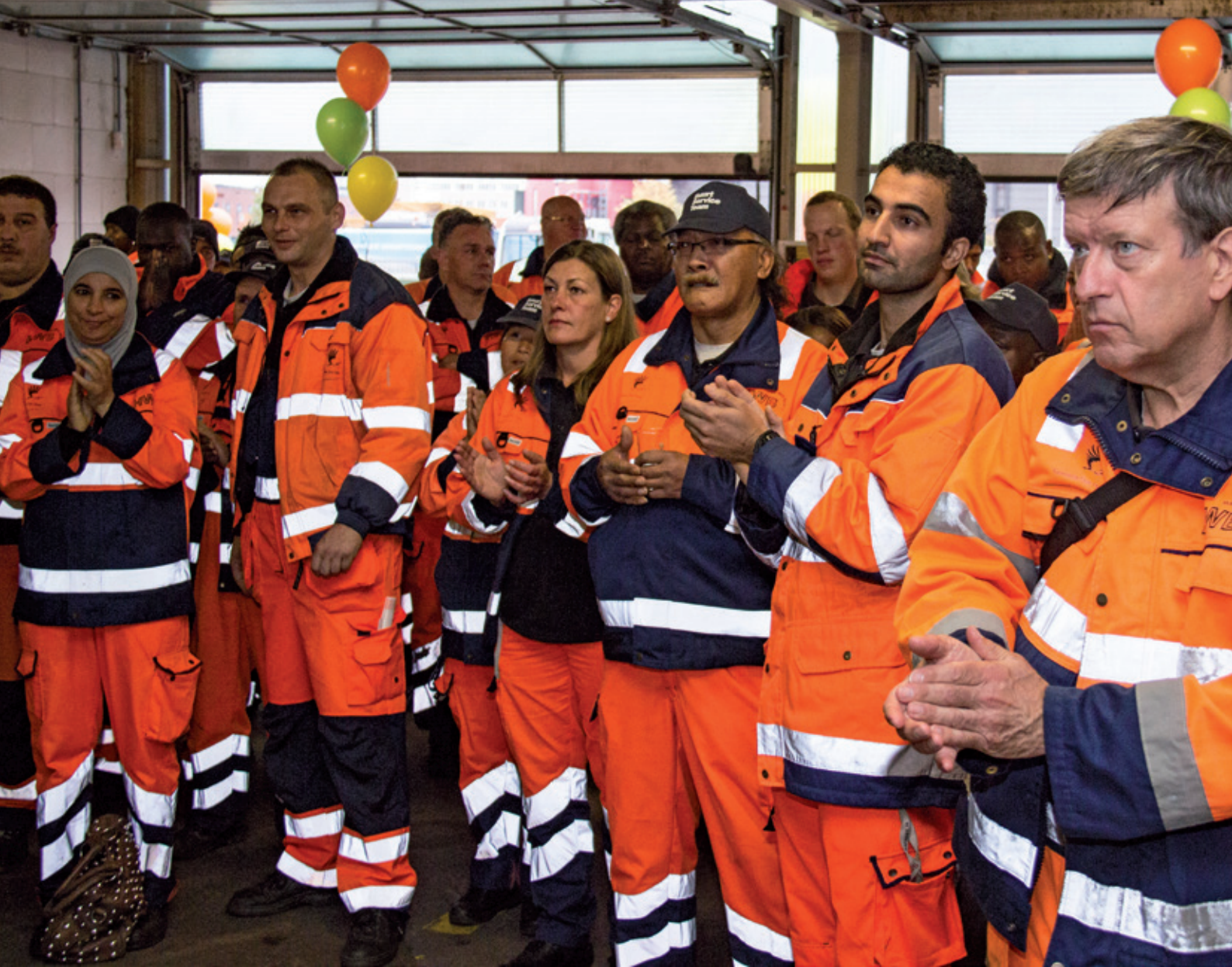
Feestelijke ontvangst van de eerste 75 straatvegers.