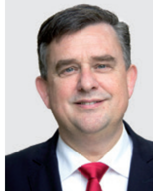
Emile Roemer fractievoorzitter SP

Op onze schouders rust een belangrijke taak. Mensen hoop én vertrouwen geven. In sociale politiek als antwoord op de problemen van deze tijd. We laten zien dat de SP de leider op links is. We zijn op weg naar een mooi congres. Ik kijk er naar uit!