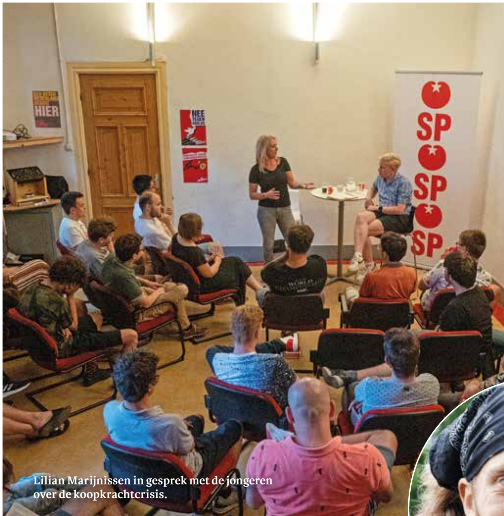
Lilian Marijnissen in gesprek met de jongeren over de koopkrachtcrisis.