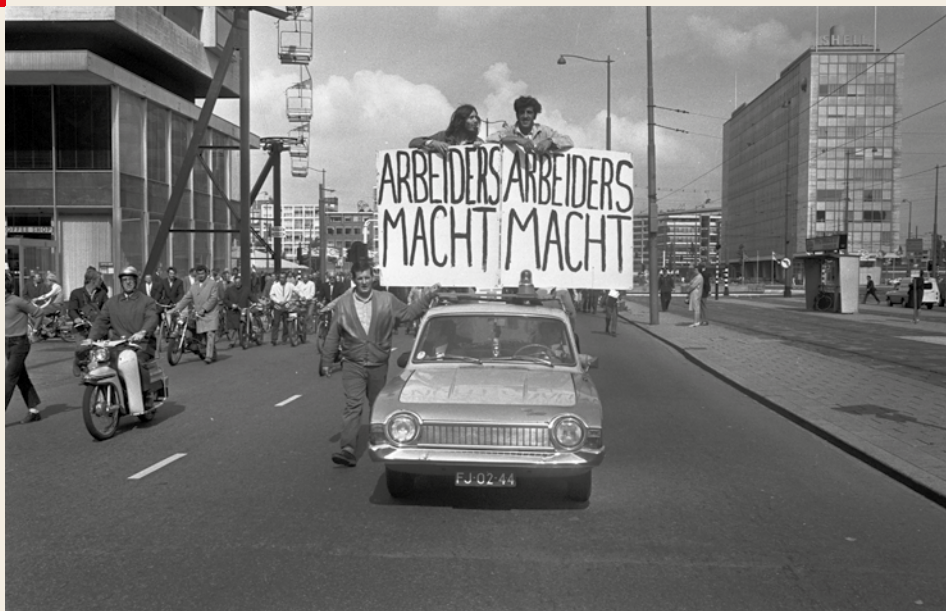
Arbeidersmacht tijdens de havenstaking van 1970.

Op 22 oktober bestaat de SP vijftig jaar. Aan de oprichting in 1972 gingen allerlei aanvaringen vooraf, die belangrijk bleken voor de toekomst van de partij. Een discussie tussen wat toen de 'theoretici' en de 'practici' werden genoemd. Mensen die vooral bezig gingen met de socialistische theorie en leden die voorop wilden lopen in de arbeidersstrijd. Op een congres van 10 oktober 1971 in Utrecht namen de voorlopers van de SP een besluit dat noodzakelijk zou zijn voor het succes van de partij: het voeren van politiek voor én met de mensen. Hoe dit moest gezien, tijdens een staking in Rotterdam.