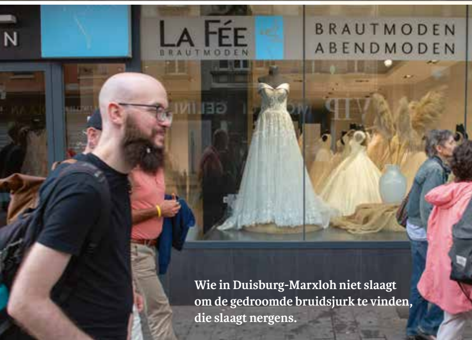
Wie in Duisburg-Marxloh niet slaagt om de gedroomde bruidsjurk te vinden, die slaagt nergens.