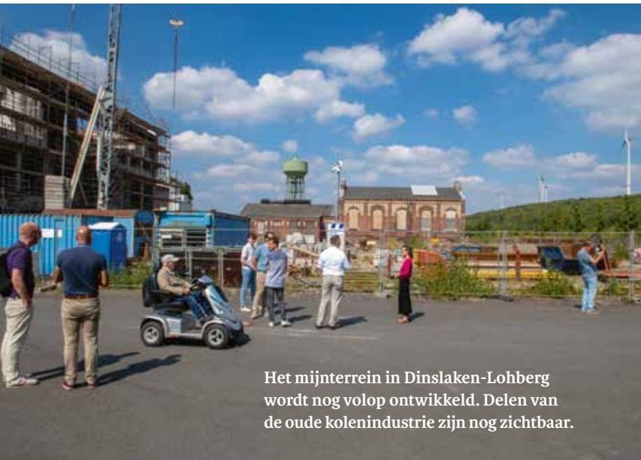
Het mijnterrein in Dinslaken-Lohberg wordt nog volop ontwikkeld. Delen van de oude kolenindustrie zijn nog zichtbaar.