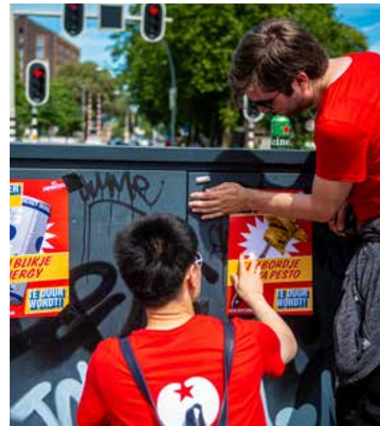
In Zwolle werd volop actie gevoerd voor de koopkrachtcampagne.