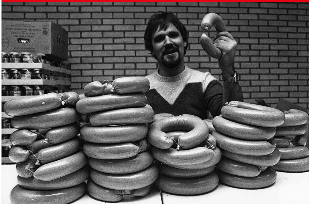
De SP zamelt voedsel in voor de stakende havenarbeiders in Rotterdam, tijdens de slepersstaking van 1979.

Wie helder wil nadenken moet gezond eten, vond de Bossche filosoof Jacob Moleschott. In de negentiende eeuw was hij de eerste wetenschapper die aandacht vroeg voor 'heel de mens', dus ook voor de materiële voorwaarden voor het denken. Deze bijna vergeten socialist streed voor de emancipatie van gewone mensen en stond aan het begin van onze latere verzorgingsstaat.