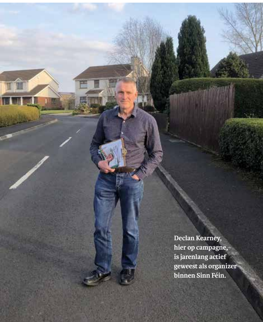
Declan Kearney, hier op campagne, is jarenlang actief geweest als organizer binnen Sinn Féin.

‘Onze voorstellen kunnen voor echte verandering zorgen’