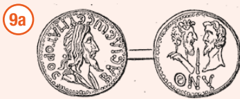
COIN OF EUPATOR. Eron: W. Smith, art. Eupator, in W. Smith, A.A. dictionary of Greek and Roman biography and mythology, II, London, 1870, p. 96.