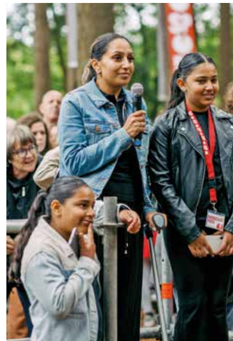
Lilian Marijnissen is strijdbaar als altijd: 'Rechts betekent geen zak voor de werkende klasse'

Kijk voor meer foto's en filmpjes op sp.nl/fam-succes