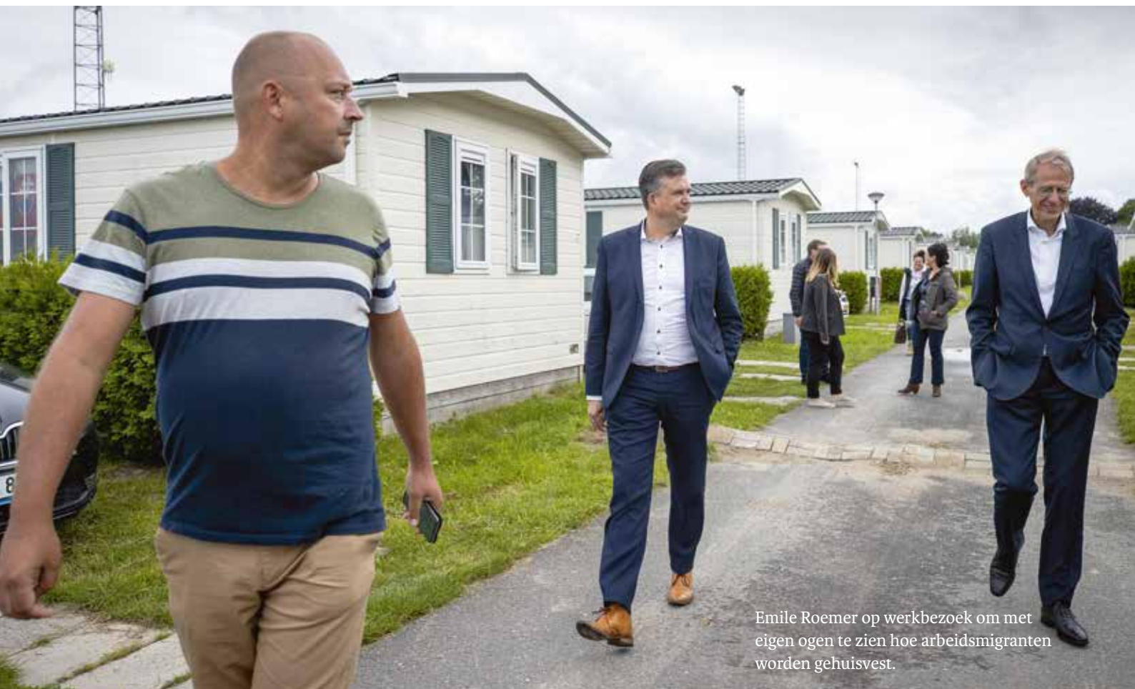
Emile Roemer op werkbezoek om met eigen ogen te zien hoe arbeidsmigranten worden gehuisvest.