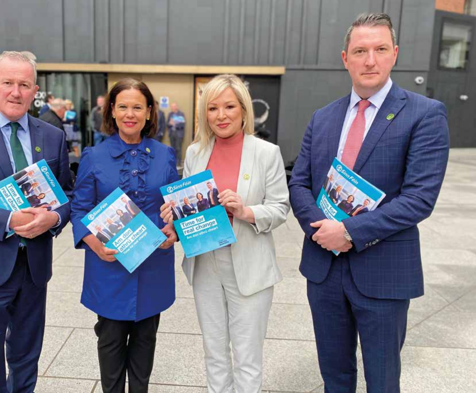
Van links naar rechts: parlementariër voor Newry en Armagh Conor Murphy, oppositieleider in de republiek Ierland Mary Lou McDonald, beoogd eerste minister Michelle O'Neill en parlementariër voor Noord-Belfast John Finucane.