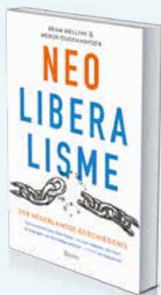
Bram Mellink en Merijn Oudenampsen Neoliberalisme. Een Nederlandse geschiedenis Boom Uitgevers: 352 pagina's: 29,90 euro.

Bram Mellink en Merijn Oudenampsen weten heel knap de personen te achterhalen die de neoliberale netwerken vormden en de plekken waar zij terecht kwamen. Vanaf de jaren vijftig kregen neoliberalen allerlei topfuncties, op de ministeries van Economische Zaken en Financiën en vanaf de jaren zestig ook bij De Nederlandsche Bank, zoals oud-premier Jelle Zijlstra. Zelfs in het 'linkse' kabinet van Joop den Uyl zaten ministers als Dries van Agt, Ruud Lubbers en Wim Duisenberg, die niet veel later pleitbezorgers werden van de neoliberale politiek.