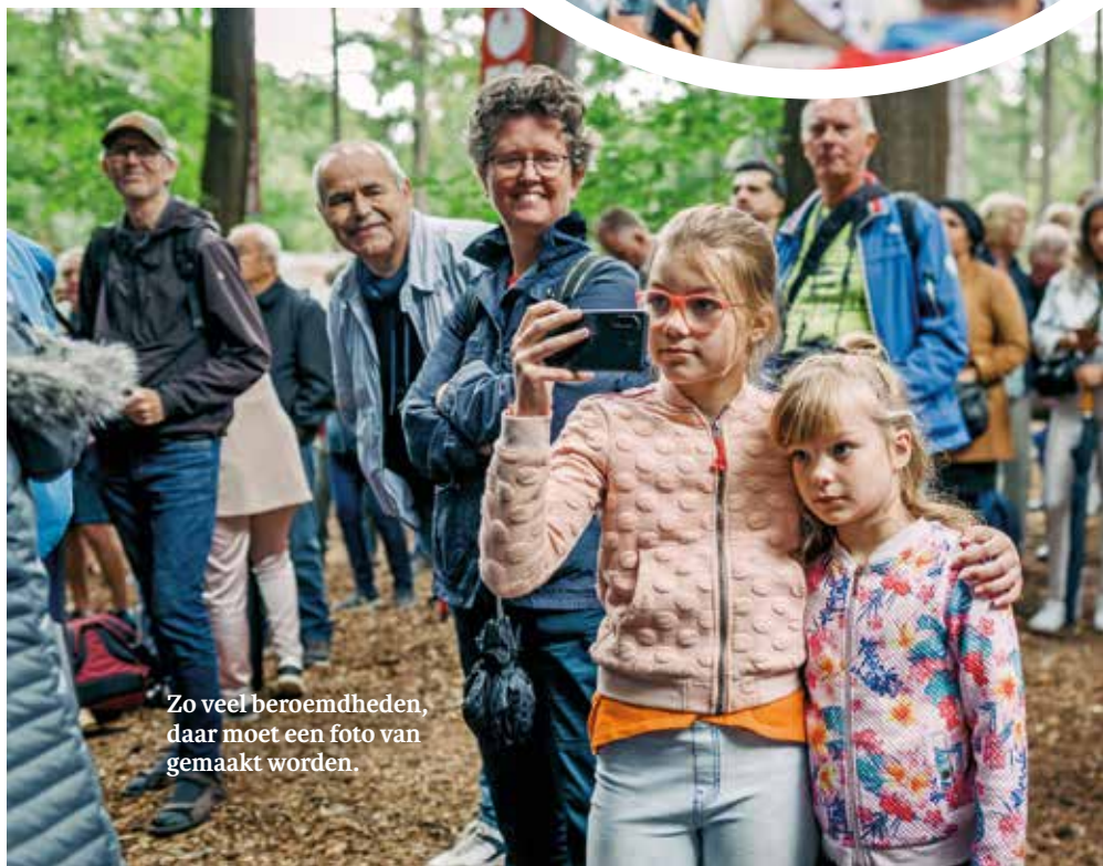
Zo veel beroemdheden, daar moet een foto van gemaakt worden.