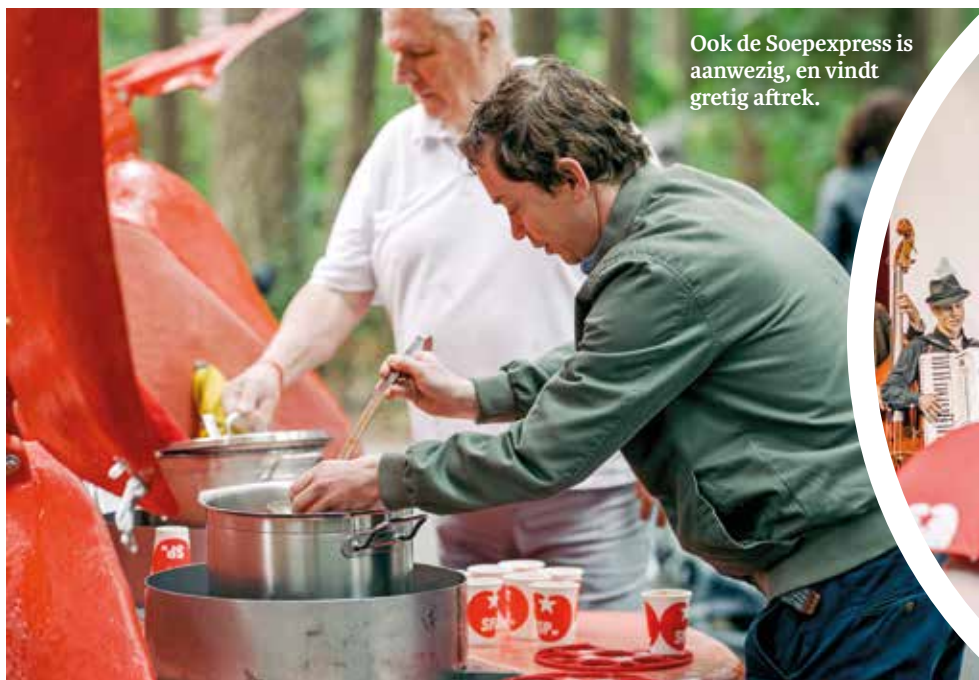
Ook de Soepexpress is aanwezig, en vindt gretig aftrek.