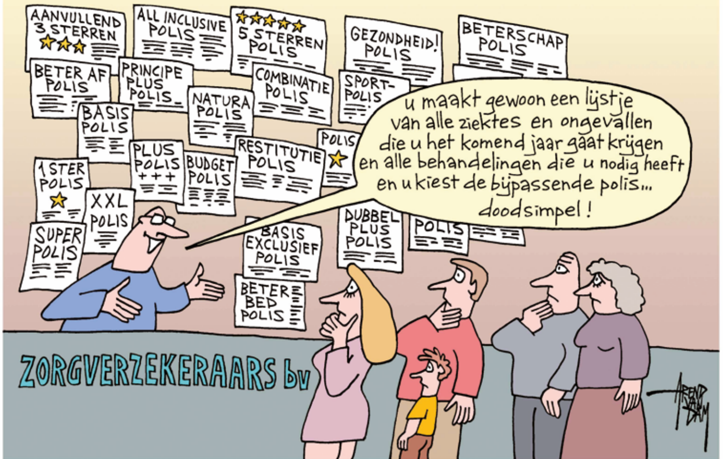
marktwerking in de zorg...