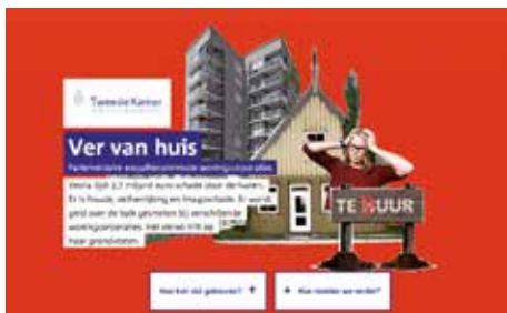
screenshot van de website woningcorporaties.tweedekamer.nl

In de eindrapportage laat de enquêtecommissie geen spaan heel van de woningcorporaties én van het toezicht door de politiek. Volgens de commissie wordt het corporatiestelsel gekenmerkt door 'fraude, zelfverrijking en imagoschade'. Hoe heeft het zover kunnen komen? De woningcorporaties hadden oorspronkelijk tot doel een einde te maken aan de woningnood: een betaalbaar dak boven het hoofd voor iedereen. Maar dat werd allemaal anders in 1994, toen de zogenoemde bruteringsoperatie van start ging, een operatie die pas in 2000 werd afgerond. In die periode trok de