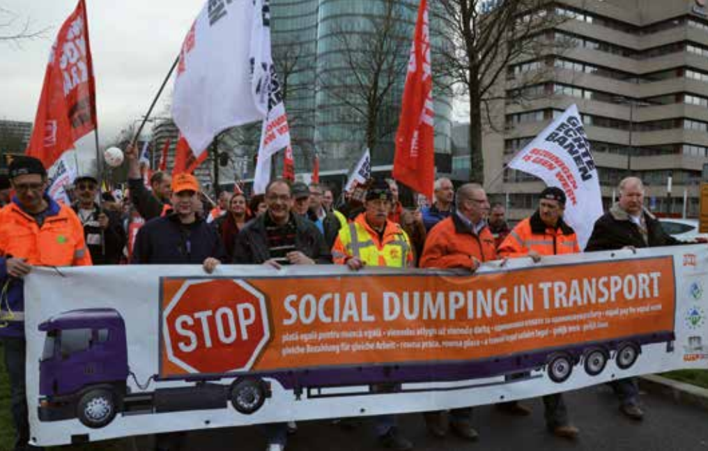
Truckers in actie tegen uitbuiting en oneerlijke concurrentie.