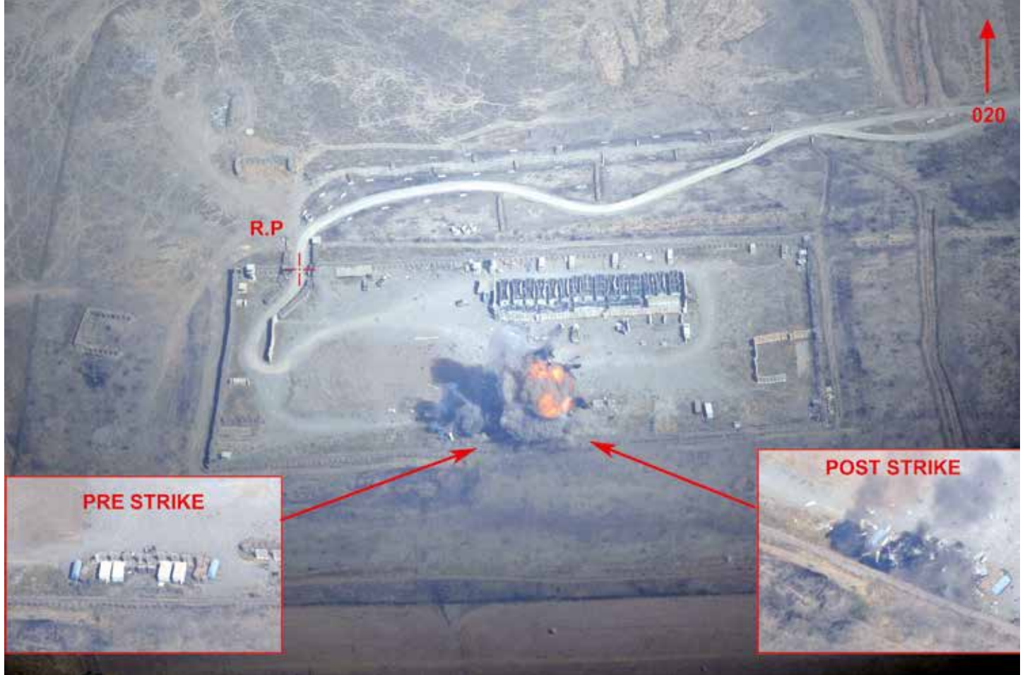
Foto's van een aanval op een logistiek terrein van ISIS, 19 september.