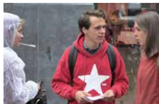
ROOD, jong in de SP, steunt het referendum. In Groningen werden handtekeningen verzameld.