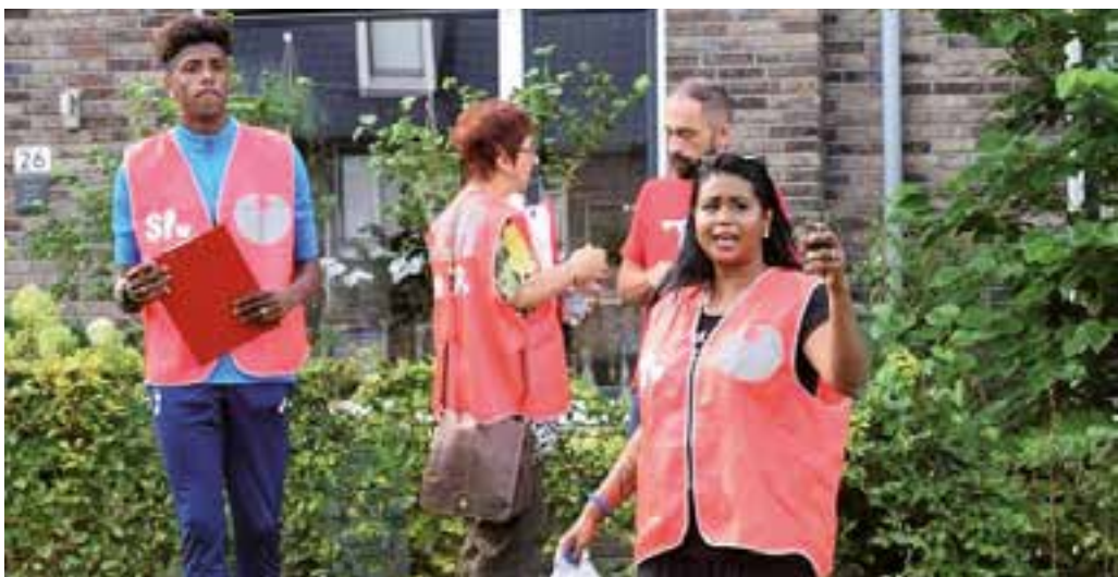
Megageitenstallen, drukke vliegvelden: de Apeldoornse SP zit er bovenop.