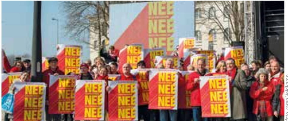
Campagne Oekraïne-referendum: Nederland zei nee.

Goed idee dus, zo een bindend referendum, want als de bevolking duidelijk nee zegt, dan moet de regering zich daaraan houden. Maar achteraf vonden de indieners het toch niet zo'n goed idee. Blijkbaar vinden ze democratie toch niet zo leuk als er niet uitkomt wat er volgens hen uit moet komen. En GroenLinks, PvdA en D66 weigerden dus de tweede behandeling in de Kamer te doen. Het zit namelijk zo: de wet was al aangenomen door de Tweede Kamer en de Eerste Kamer, maar omdat de grondwet veranderd moet worden, moet