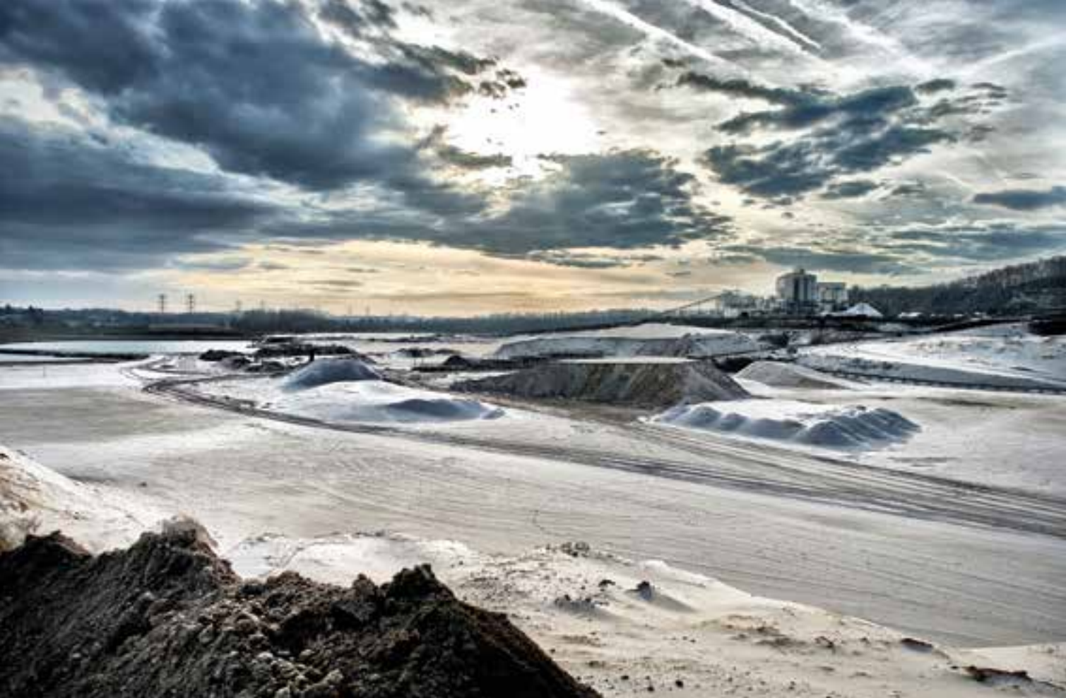
Het kraterlandschap van de zandafgraving.

Het dreigement van Gedeputeerde Staten om desnoods met een provinciaal inpasingsplan het door Heerlen en Landgraaf afgewezen plan van transformatie af te dwingen en het verzet te omzeilen, is aangestuurd door Sibelco en 'dient geen enkel provinciaal belang'.