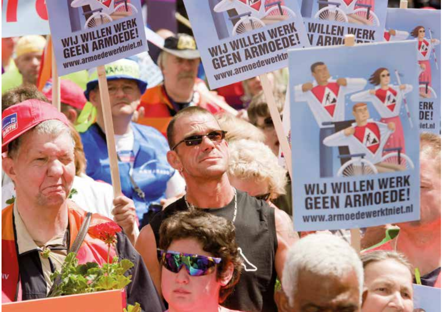
De SP strijdt al heel lang tegen de afbraak van de sociale werkplaatsen. Op de foto een demonstratie in 2011 met als thema Wij willen werk geen armoede!