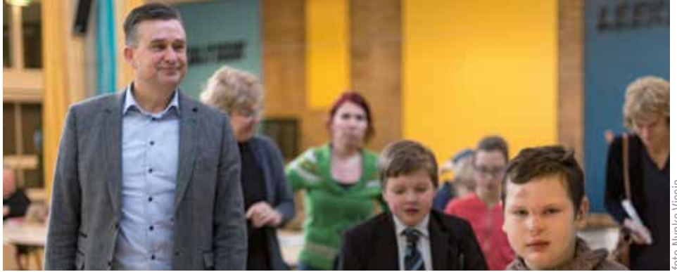
Emile Roemer op bezoek bij de St. Maartenschool.

De St. Maartenschool in Ubbergen verzorgt het onderwijs aan kinderen met een lichamelijke of meervoudige beperking en langdurig zieke kinderen. Het speciaal onderwijs wordt door de Wet passend onderwijs niet meer apart gefinancierd. Al het geld voor scholen gaat naar een samenwerkingsverband dat het geld verdeelt. In het geval van de St. Maartenschool werden kinderen in ruim de helft