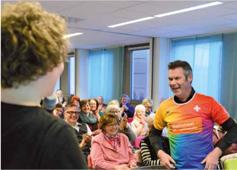
Jos de Blok, oprichter van de thuiszorgorganisatie Buurtzorg, trekt een shirt van het Nationaal ZorgFonds aan, met de belofte dat hij het ook zal dragen als hij gaat hardlopen.

ren dat het Nationaal ZorgFonds niet uit één enkele partij zal bestaan.'