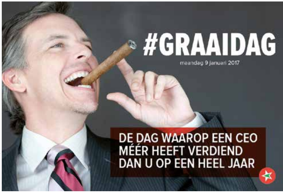
poster PVDA België©