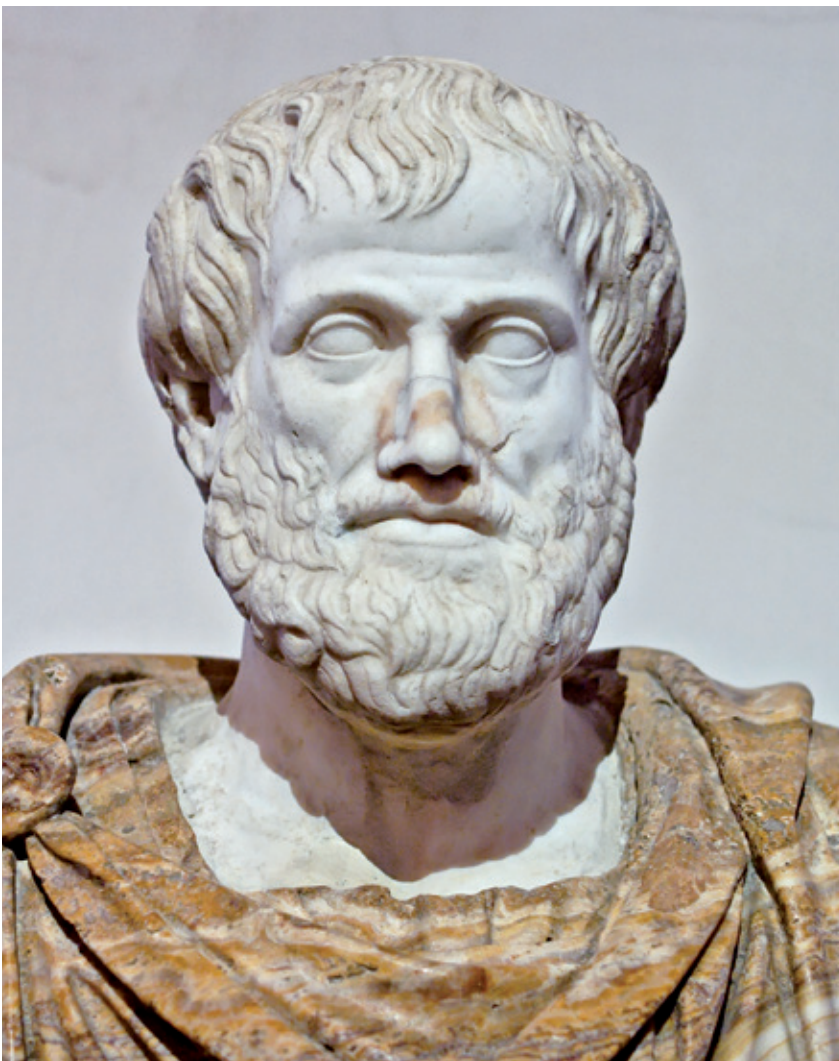
Aristoteles reikt zorgethiek aan als ethisch fundament. Zorg ontstaat daar waar mensen persoonlijk verantwoordelijkheid nemen voor een situatie waar ze niet zelf voor verantwoordelijk zijn.

een belangrijke rol speelt. Pensioenfondsen financieren nu bijvoorbeeld veel fossiele bedrijven, zoals oliemaatschappijen. Dat moet veranderen. De grens waarbinnen klimaatverwarming nog beheersbaar is, is volgens de meeste deskundigen maximaal twee graden. Maar als alle voorraden op de balans van gas- en oliemaatschappijen verbruikt worden, dan wordt die grens al overschreden. Als we de twee-gra-dengrens hanteren moet minstens een derde van de voorraden onder de grond blijven. Daar zijn dus grote financiële belangen mee gemoeid.’