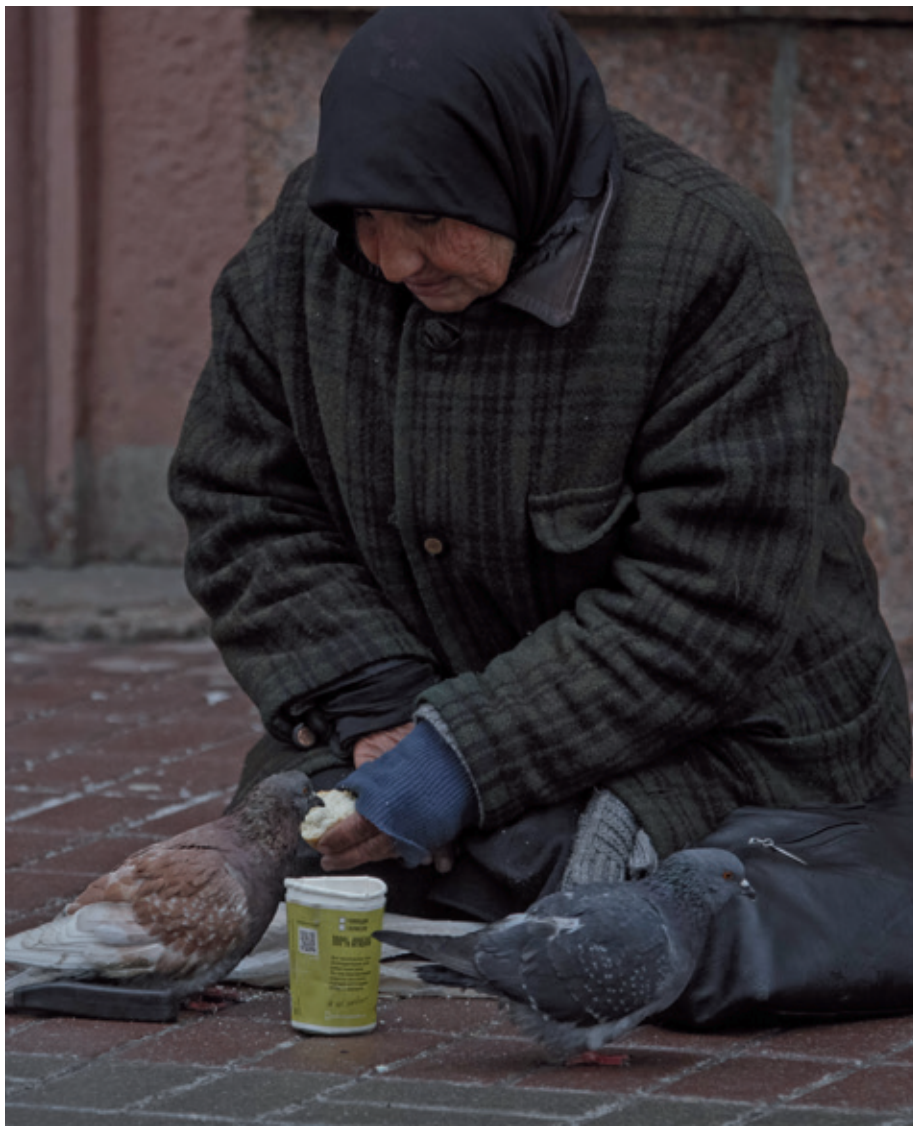
Dakloze bejaarde vrouw in Kiev.

helden, die het land verdedigd hebben. Maar bij terugkomst zijn er geen banen voor ze. Daarom staan ze nu voor het presidentsgebouw in Kiev om uitkeringen voor militairen te eisen. De ambtenaren daar zeggen dan: wij hebben jullie niet naar het front gestuurd. Daardoor voelen ze zich bij het vuilnis gezet. Misschien gaan ze nu criminele organisaties vormen. Ik ben een politiek tegenstander van Porosjenko, maar als hij zich op dit moment niet opstelt als een autoritair leider, zou Oekraïne in gevaar raken. Porosjenko en zijn klik