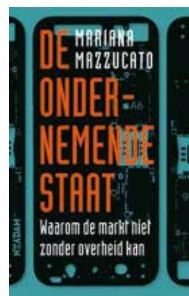
Mariana Mazzucato De ondernemende staat. Waarom de markt niet zonder overheid kan Uitgeverij Nieuw Amsterdam

Dit boek, oorspronkelijk geschreven als pamflet om de Britse overheid te weerhouden van bezuinigingen op de wetenschap, biedt veel voorbeelden en argumenten om de strijd met de ideologie van meer markt en minder overheid aan te gaan. Daarnaast zet het boek aan tot nadenken over hoe we onderzoek en innovatie beter zouden kunnen organiseren.