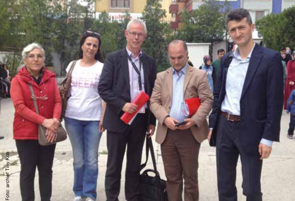
Tiny Kox te midden van binnenlandse waarnemers voor een stemlokaal in de Turkse hoofdstad Ankara.

tatie. Ik heb de Kiesraad daar ook op gewezen en heb na de verkiezingen de Turkse autoriteiten en het Turkse parlement dan ook voorgesteld deze gang van zaken goed te onderzoeken, omdat het een slechte zaak is dat de president de grondwet willens en wetens terzijde schuift.