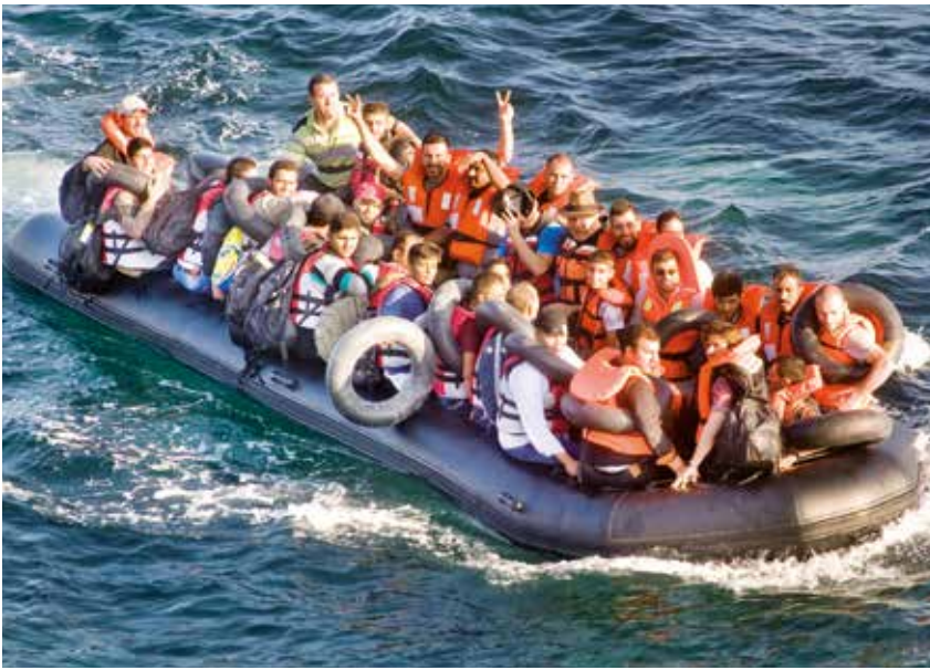
Aankomst van vluchtelingen in bootjes op de stranden van het Griekse eiland Lesbos.

Tekst: Harry van Bommel en Jip van Dort