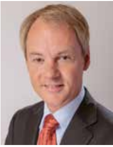
Harry van Bommel is woordvoerder Buitenlandse Zaken voor de SP in de Tweede Kamer.

2013 de coup tegen Morsi leidde – president van het land. Met zijn critici heeft hij hardhandig afgerekend. Meer dan duizend mensen die tegen de staatsgreep demonstreerden werden in koelen bloede gedood en vele tienduizenden werden opgepakt en opgesloten in overvolle gevangenis- en opgesloten in overvolle gevangenis- waar marteling aan de orde van de dag is. Na onderzoek van deze terreur tegen de burgerbevolking sprak de Amerikaanse mensenrechtenorganisatie Human Rights Watch over waarschijnlijke misdaden tegen de menselijkheid.