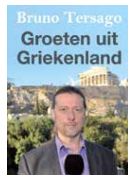
Bruno Tersago Groeten uit Griekenland Uitgeverij EPO

Groeten uit Griekenland zou verplichte literatuur moeten zijn voor al die Europese leiders die maar blijven volhouden dat Griekenland te weinig doet om de economie te hervormen. Als er één land hervormd heeft in de afgelopen jaren, dan is het Griekenland wel. Wat daar de gevolgen van zijn voor de gewone Griek laat Tersago op treffende wijze zien aan de hand van vele persoonlijke verhalen, onderbouwd met cijfers en statistieken.