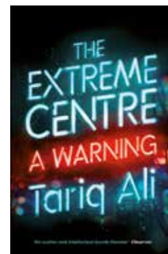
Tariq Ali The Extreme Centre: a Warning Uitgeverij Verso

Nederland, waar het extreme centrum (D66, VVD, PvdA en het CDA) sinds 1994 Nederland meer en meer tot een op export gericht lagelonenland heeft gemaakt, tot een belastingparadijs voor multinationals en tot een nog trouwere bondgenoot van de VS. De PvdA heeft consequent en compromisloos voor deze koers gekozen. Het wordt tijd om de partij niet meer te zien als (potentieel) links, maar als trouwe bondgenoot van bankiers, belastingontduikers en consultants. De kopstukken worden tenslotte zelf bankier of consultant na een kortstondig politiek intermezzo. De sociaaldemocratie heeft nu zo vaak rechts gehandeld, dat wie haar nog als links ziet aan zelfbedrog doet. Het extreme centrum zal dat zelfbedrog zo lang mogelijk in stand houden. Kranten zullen nog jaren volstaan over het verraad van de PvdA. Er is echter niets dat het extreme midden meer plezier doet dan de woede na weer een gebroken verkiezingsbelofte. Die woede duidt op nog bestaande hoop, die bij de volgende verkiezingen weer aangesproken kan worden. Het opgeven van de hoop is daarmee volgens Ali de voorwaarde om werkelijk iets te bereiken.