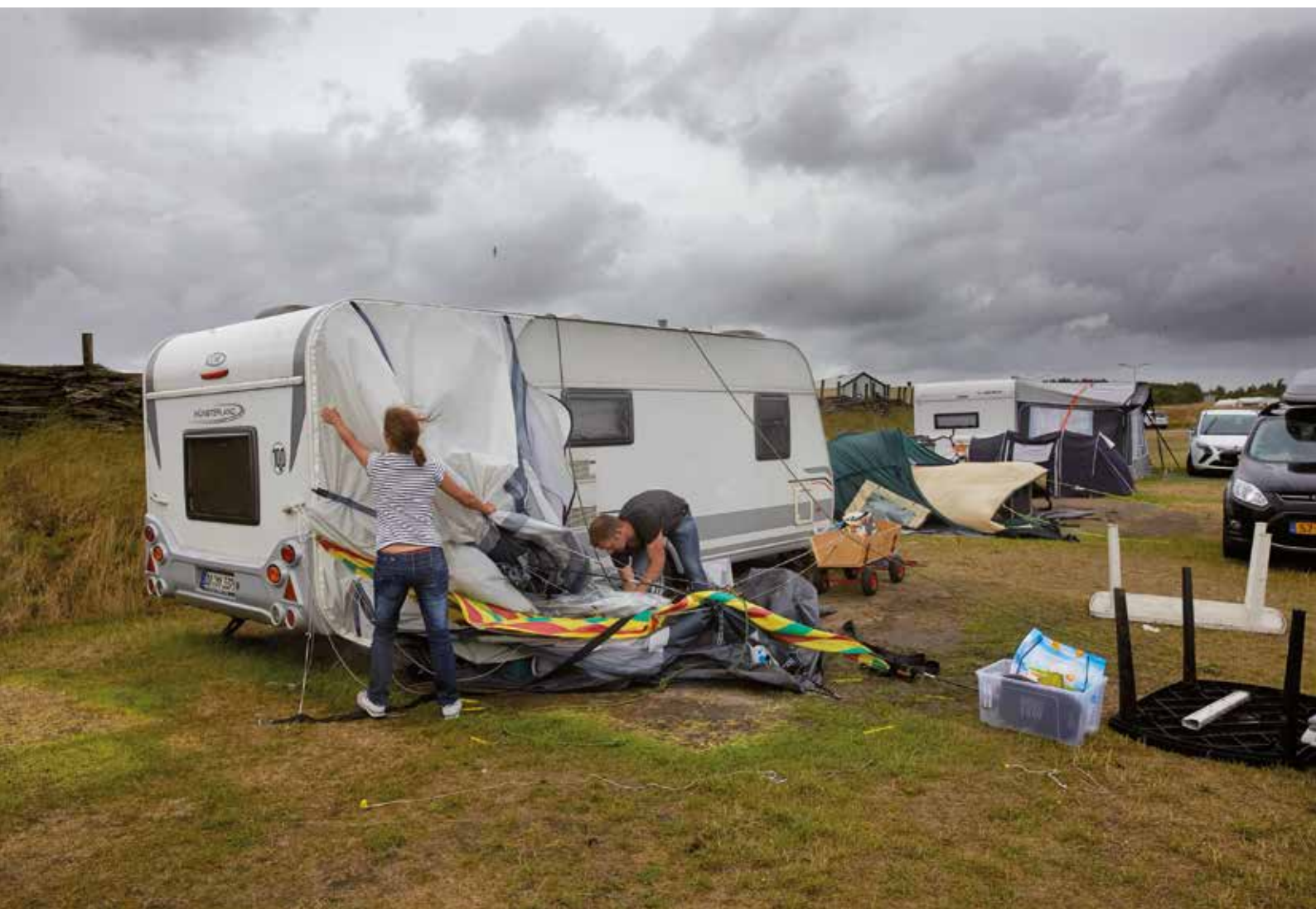
Zwaarste julistorm sinds 1901 treft camping in het Noord-Hollandse Petten.

windenergie. Multinationals zijn daar in elk geval zeker niet toe bereid. Shell staat op het punt om naar olie te gaan boren op de Noordpool, wat een verdere bedreiging vormt voor het fragiele ecosysteem. En dat alleen maar om nog meer winst voor de aandeelhouders te behalen. Grote overheidsinvesteringen en andere maatregelen vanuit de overheid zijn dus onmisbaar in de strijd tegen klimaatverandering. Overheidsingrijpen gaat echter in tegen het neoliberale denken dat tegenwoordig regeert, waarbij de markt als oplossing voor alle maatschappelijke problemen wordt gepresenteerd. Dat moet veranderen.