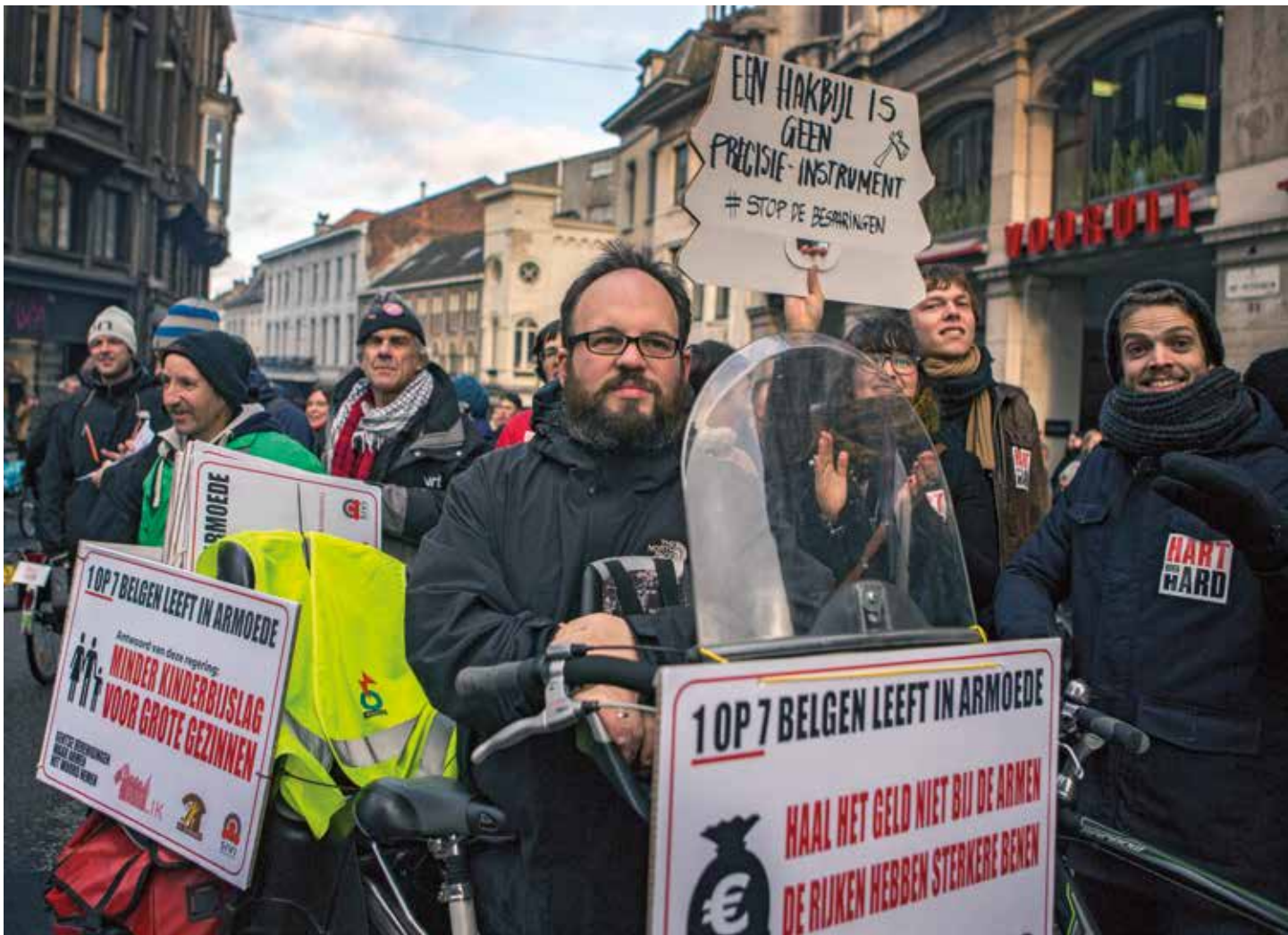
15 december 2014, landelijke staking in België.