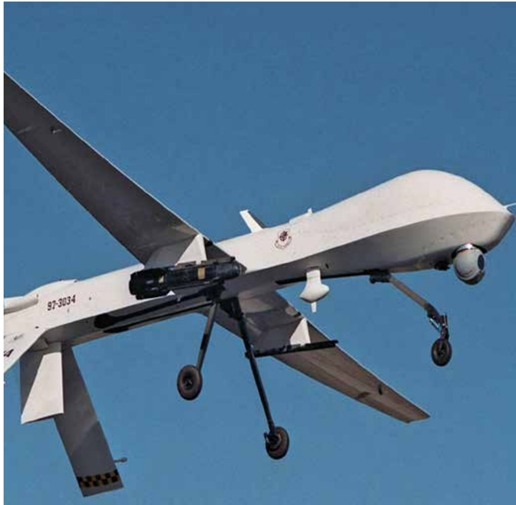
Een Amerikaanse MQ-1 Predator drone.

Een belangrijke vraag is of het hier om oorlogshandelingen of om buitengerechtere executies of 'targeted killings', gaat. Beide laatste termen hebben betrekking op het doden van individuen buiten het slagveld of zonder rechterlijke uitspraak. In het eerste geval koppelt men het begrip aan bijvoorbeeld doodseskaders en wordt het als illegaal beschouwd. Bij 'targeted killings' zou het onder strikte voorwaarden gerechtvaardigd zijn (men haalt graag de dood van Osama bin Laden als voorbeeld aan). De Amerikaanse regering kiest duidelijk voor de laatste zienswijze, onder het mom dat nood wet breekt. Zo staat onder meer in een persverklaring van 23 mei 2013: (...) the United States will use lethal force only against a target that poses a continuing, imminent threat to U.S. persons. Deze 'targeted killings' zijn ook nog aan strikte regels gebonden: bijna zekerheid van de aanwezigheid van de persoon, bijna zekerheid dat geen burgers geraakt kunnen worden, gevangenneming of andere opties zijn afwezig, de regering van het betref-