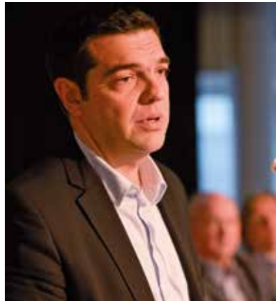
Alexis Tsipras, leider van de Griekse linkse partij Syriza.

Wat Griekenland nodig heeft, is juist de beëindiging van het bezuinigingsprogramma. Door dit programma is de staatsschuld gestegen van 120