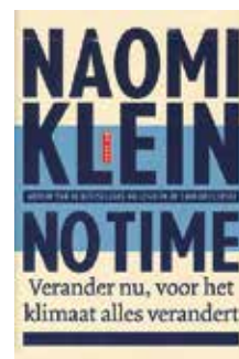
Naomi Klein No Time. Verander nu, voor het klimaat alles verandert Uitgeverij De Geus

'de vervuiler betaalt', tot enorme overheidsinvesteringen om deze hele transitie te financieren. Klein vestigt haar hoop daarbij niet op politici, omdat zij te zeer zijn beïnvloed door de 'verstikkende vrijemarktideologie', maar op sociale bewegingen van onderop die wereldwijd de strijd met de fossiele-brandstofindustrie aangaan. Deze lokale actiegroepen, die Klein de verzamelnaam Blockadia geeft, hebben al verschillende successen geboekt. Zo hebben klimaatactivisten de Keystone XL-pijpleiding, die ruwe olie van de Canadese provincie Alberta naar Amerikaanse raffinaderijen in de Golf van Mexico moet transporteren, tot nog toe weten tegen te houden. Zaak is nu dat al deze verschillende actiegroepen samengaan in een grote klimaatbeweging, want alleen met een massaverzetsbeweging kun je een 'diepgaande en radicale, economische transformatie' afdwingen. Uiteindelijk zal er een alternatief wereldbeeld geformuleerd moeten worden, dat het kan opnemen tegen het neoliberale wereldbeeld waardoor de klimaatcrisis is veroorzaakt. 'En dit keer moet aan de basis van dat wereldbeeld onderlinge afhankelijkheid staan in plaats van hyperindividualisme, wederkerigheid in plaats van dominantie, en samenwerking in plaats van hiërarchie', aldus Klein.