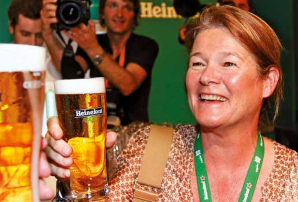
Charlène de Carvalho Heineken, de rijkste Nederlander, zag haar vermogen de afgelopen 12 jaar bijna verdrievoudigen tot 7,3 miljard euro.

juist dat de grootste groei van het vermogen zit bij de kleine groep van superrijken, de rijkste 1 procent van de bevolking, of een nog kleinere groep. Het zijn juist deze superrijken die door de omvang van hun vermogen de hoogste rendementen weten te halen en zo steeds verder op de rest vooruit gaan lopen.