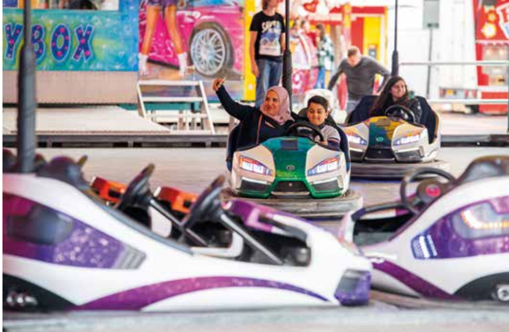
In virusvrije tijden vinden jaarlijks tussen de 1400 en 1500 kermissen plaats.