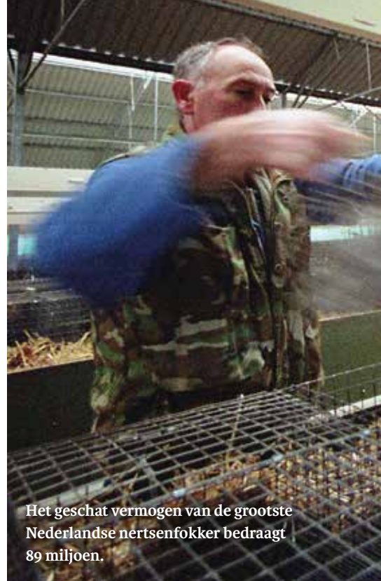
Het geschat vermogen van de grootste Nederlandse nertsenfokker bedraagt 89 miljoen.