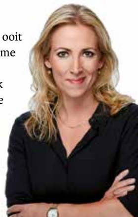
Lilian Marijnissen fractievoorzitter SP

Een sterke SP is meer dan ooit nodig om het neoliberalisme definitief te begraven. Voor een sociaal en eerlijk alternatief. Het zijn mooie tijden om socialist te zijn!