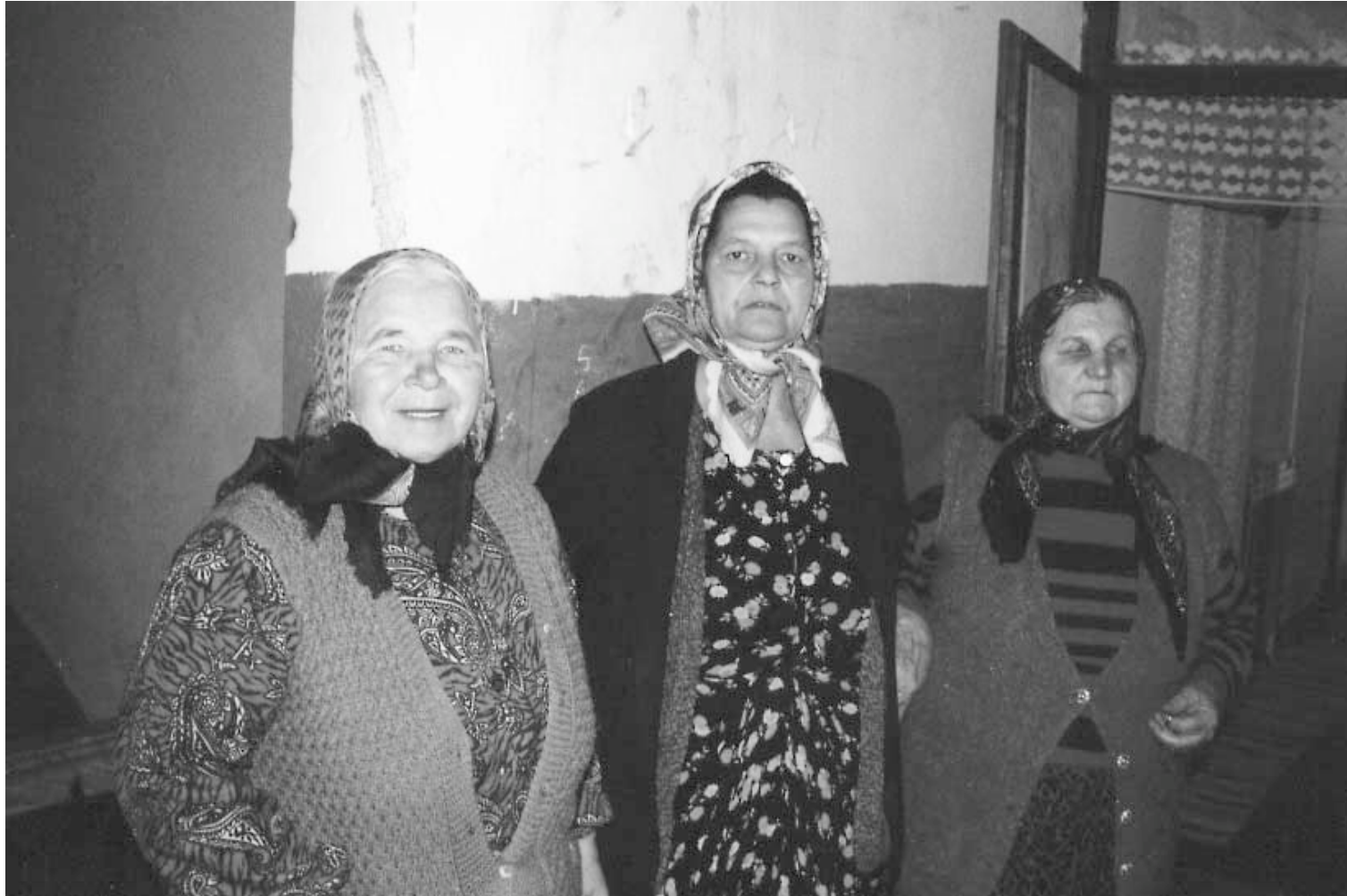
Vrouwen en kinderen waarvan hun mannen en vaders worden vermist