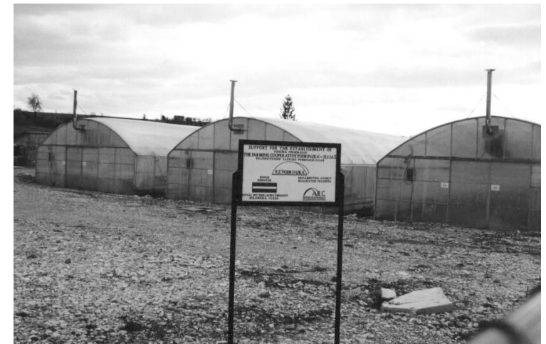
Groentekassenproject in Ilias

Alle hulpverleners en medewerkers van het internationaal bestuur zeggen dat er veel meer geïnvesteerd zou moeten worden in inkomsgenererende projecten.