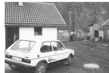
Foto linksonder: huisjes in Jezevac waarin gemiddeld 14 mensen wonen