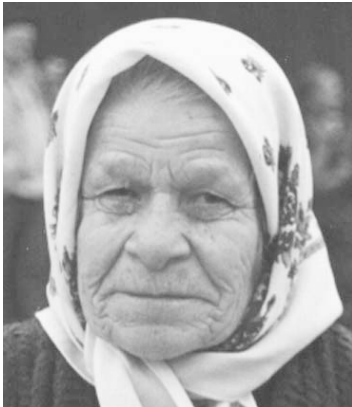
Weduwe van Srebrenica woont in Grab Potok

We hebben met vele vrouwen, hulpverleners en medewerkers van het internationaal bestuur gesproken (zie bijlage 1). Als het gaat om de toekomst, zijn hulpverleners sterk gericht op terugkeer, terwijl de meeste vrouwen nog onmogelijk aan terugkeer kunnen denken. Ze zijn nog steeds bezig met overleven. Heb ik morgen nog een dak boven mijn hoofd? Hoe geef ik mijn kinderen voldoende eten? Maar vooral ook: wanneer wordt mijn man, zoon, vader gevonden? Bovendien hebben ze grote angst – vanwege onveiligheid en emoties – om terug te keren.