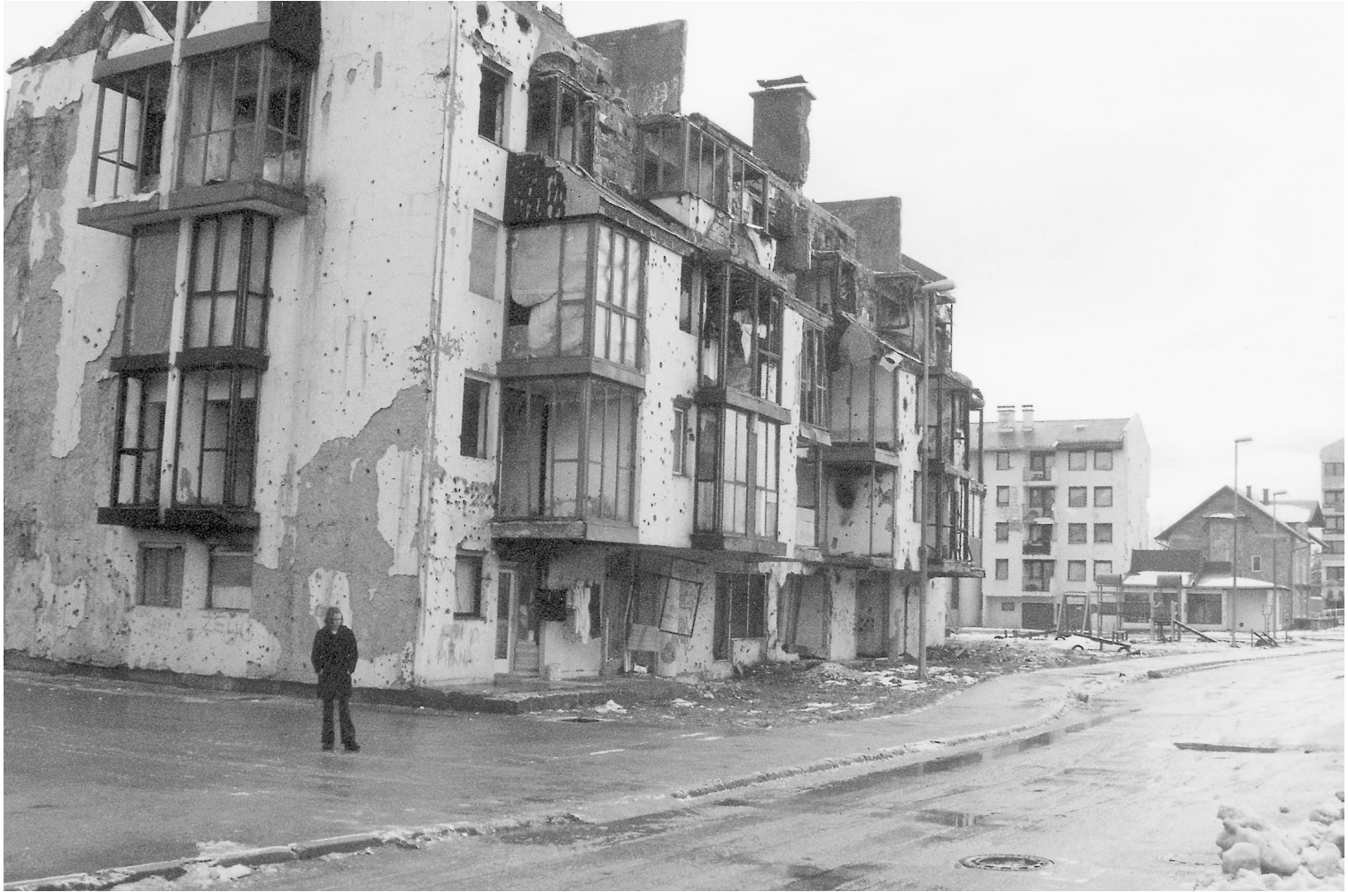
Kapotgeschoten appartementen in Otes, verlaten door Serviërs en nu bewoond door weduwen van Srebrenica.