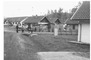
Rechtsonder: Kamp in Grab Potok