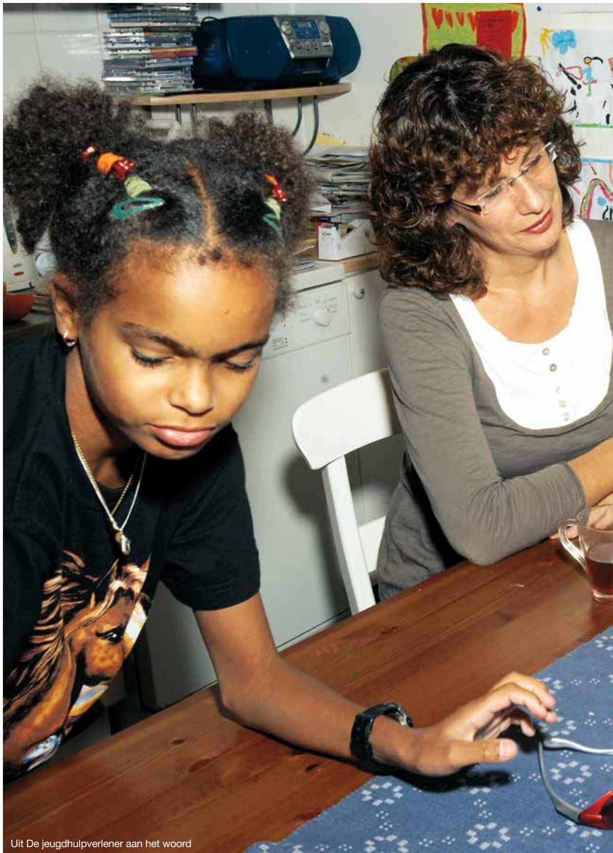
Uit De jeugdhulpverlener aan het woord