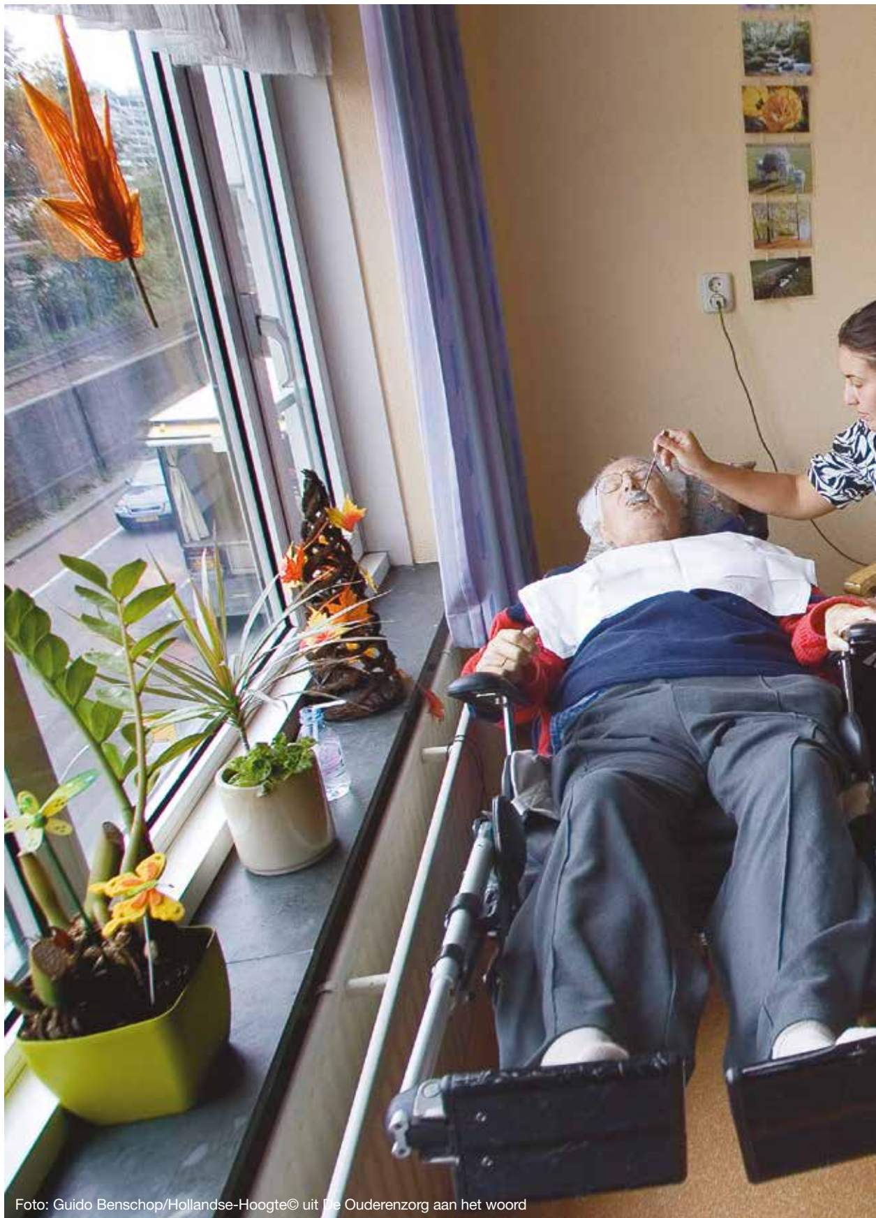
Foto: Guido Benschop/Hollandse-Hoogte© uit De Ouderenzorg aan het woord