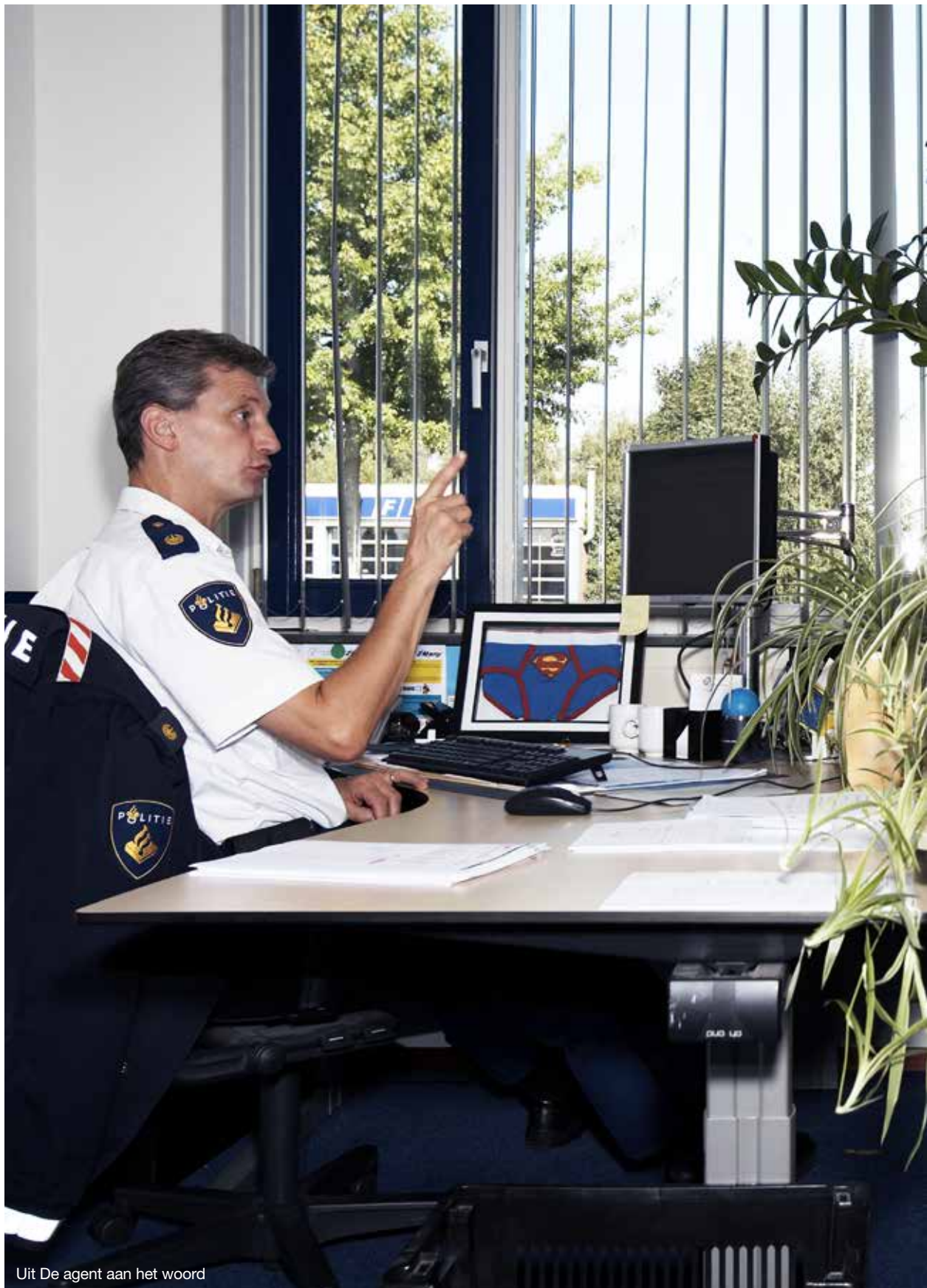
Uit De agent aan het woord