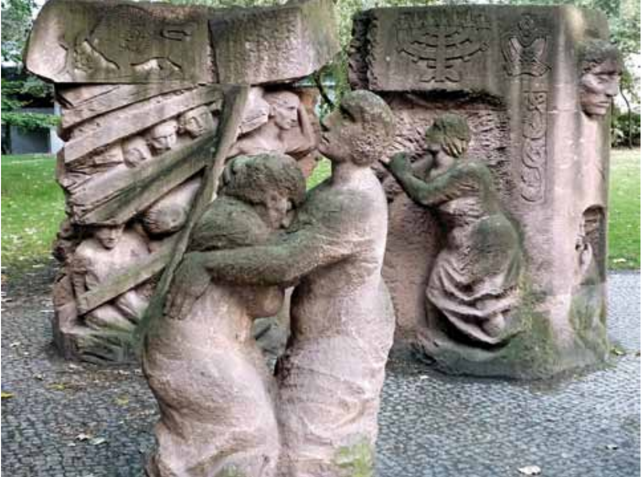
Dit beeldhouwwerk in de Rosenstrasse in Berlijn, is een gedenkteken voor de niet-joodse vrouwen die demonstreerden tegen de arrestatie en dreigende deportatie van hun joodse mannen. Dankzij deze protesten werden de mannen uiteindelijk vrijgelaten.

Italiaanse soldaten fusilleren en 4500 in concentratiekampen verhongeren. Zij werden als mannen van een inferieure kwaliteit beschouwd. Het superieure Germaanse ras moest natuurlijk ook uit gezonde mannen en vrouwen bestaan, klaar voor de komende oorlog. Verstandelijk gehandicapte en geesteszieke kinderen bedreigden de raszuiverheid en vormden een financiële belasting. Daarom werd in het diepste geheim de Aktion T4 voorbereid, een plan om deze kinderen te doden. De actie startte begin 1940 en eindigde onder druk van de katholieke kerk op 18 augustus 1941. Maar toen waren er al 70.000 kinderen door vergiftiging of vergassing om het leven gebracht. Sinti en Roma, die in Duitsland de scheldnaam Zigeuner kregen, werden als asociale elementen in de concentratiekampen opgesloten. Naar schatting kwamen 450.000 van hen om het leven.