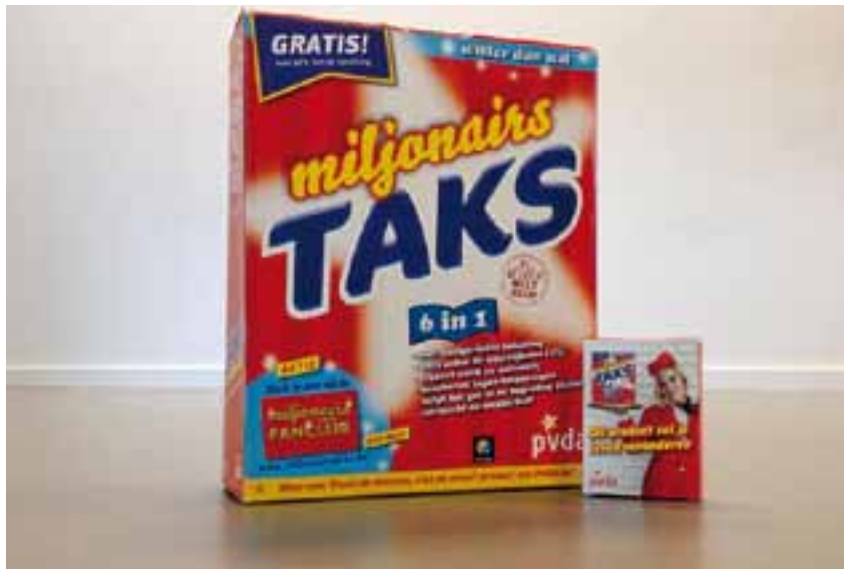
Actiemateriaal bij de miljonairstaks-campagne van de Belgische PVDA.