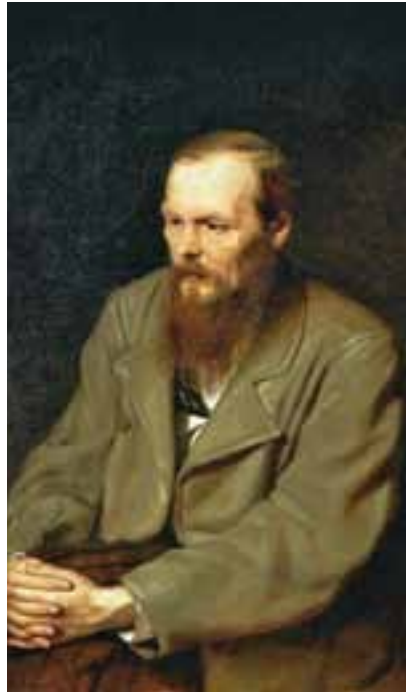
Fjodor Dostojevski (door Vasili Perov, 1872).

De idioot in dit boek is vorst Mysjkin, de laatste telg uit een oud Russisch adellijk geslacht, die zijn jeugd heeft doorgebracht in Zwitserland, waar hij werd behandeld voor de vallende ziekte. Na zijn terugkeer in Rusland mengt hij zich in de hoogste sociale kringen, die leven volgens strakke sociale codes. De vorst wordt verliefd op de goede generaalsdochter Aglája, maar nog meer op de schone maitres-