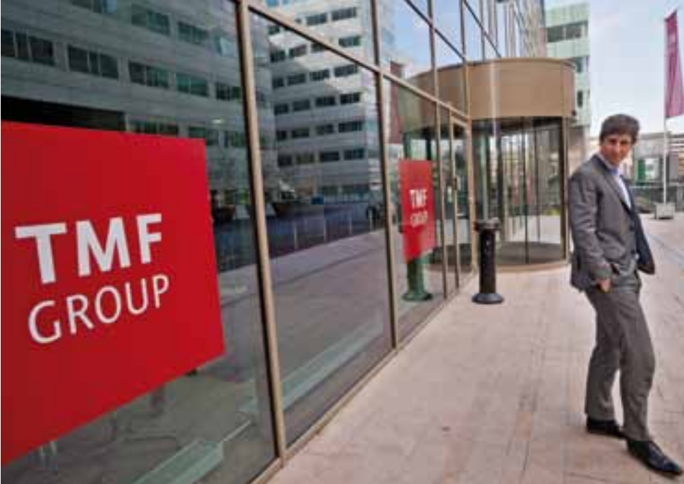
Het trustkantoor van de TMF Group in Amsterdam, waar rond de 3500 internationaal opererende bedrijven onderdak hebben gevonden met het doel gebruik te maken van de gunstige belastingfaciliteiten in Nederland.

Het uitbreken van de kredietcrisis heeft het probleem blootgelegd. Overheden hebben te maken met een sterke afname van de belastinginkomsten. Dat wordt veroorzaakt door de economische malaise en de afgenomen winsten, maar ook door een enorme groei in het gebruik van belastingconstructies. Eind 2009 besteedde Zembla een aflevering aan de mazen in de belastingwet, waarin professor Michielse van de Universiteit van Utrecht na onderzoek concludeerde dat Nederland jaarlijks 16 miljard euro aan belastinggeld misloopt als gevolg van belastingontwijking door multinationals. Door handig gebruik te maken van de Nederlandse belastingwetgeving, zo stelde Michielse, betaalden veel grote bedrijven niet het toenmalige belastingtarief van 25,5 procent over hun winsten, maar effectief slechts 6-7 procent.