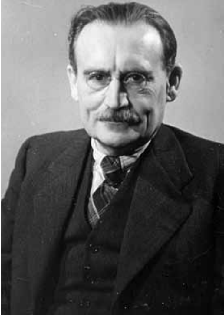
Onder leiding van PvdA-leider Willem Drees kwam de Werkloosheidswet (WW) tot stand, die in 1952 in werking trad.

die geen aanspraak konden maken op andere werkloosheidsvoorzieningen. Met al deze wettelijke regelingen werd de positie van de werkloze werknemer in belangrijke mate verbeterd. Vanaf de jaren tachtig werden door de rechtse kabinetten-Lubbers de sociale voorzieningen, waaronder de WW, echter steeds verder afgebroken. In 1985 werden zowel de WW als de WWV versoberd, door de uitkering terug te brengen naar 70 procent van het laatstverdiende loon. In 1987 werden de WW 1949 en de WWV vervangen door een nieuwe Werkloosheidswet, de WW 1986. De WW werd nu afhankelijk gemaakt van leeftijd en arbeidsduur. Een argument was het stelsel van sociale zekerheid te vereenvoudigen, maar belangrijker was het bezuinigingsmotief: de WWV