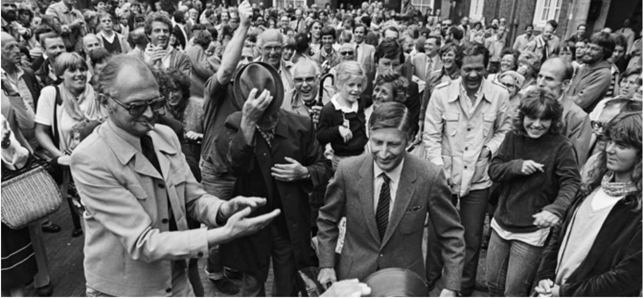
1981: Premier en CDA-onderhandelaar Dries Van Agt steekt het Binnenhof over op weg naar de formateurs en naar het kabinet van Agt-Den Uijl.

formateurs, maar ook de betrokken politici geven voortdurend persconferenties. Het proces is normaal gesproken gebaat bij beslotenheid, dat onderhandelt het makkelijkst. Maar soms wordt de pers ook ‘gebruikt’. Onderhandelende partijen laten dan kleine overwinninkjes naar buiten komen, om de achterban tevreden te houden. Meestal komt dat de voortgang van de formatie niet ten goede.