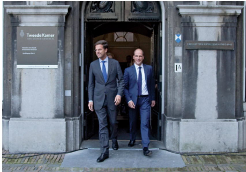
Rutte en Samsom hebben zojuist voor het eerst samen en tegelijkertijd met verkenner Henk Kamp gesproken.

Ook onderzoek van Maurice de Hond laat zien dat er op belangrijke terreinen geen meerderheid is voor een rechts-liberaal beleid. Zo is 70 procent van de bevolking voor een inkomensafhankelijke zorgpremie, 79 procent van de kiezers tegen de verhoging van het eigen risico in de zorg en 86 procent voor het behoud van het minimumloon. Ook bij kiezers van rechtse partijen is een meerderheid voor het organiseren van gemeenschappelijke verantwoordelijkheden. Alleen bij de inkomensafhankelijke zorgpremie is een meerderheid van de VVD-kiezers tegen. Ook zo bezien zal buiten het parlement rechts beleid tegen grote maatschappelijke weerstand oplopen.