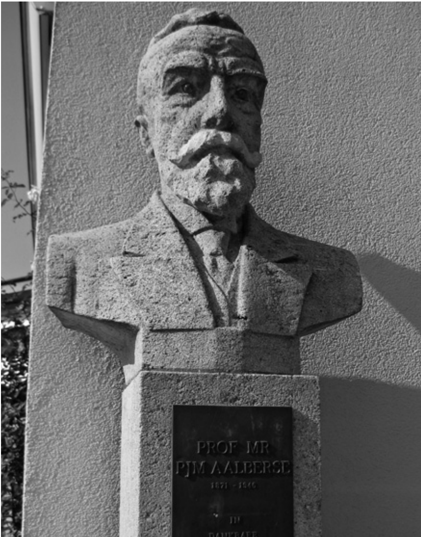
Borstbeeld van de sociaal bewogen katholieke minister van Arbeid Piet Aalberse (1871-1948) die in 1919 de Arbeidswet invoerde.

voor de invoering van de Invaliditeitswet, de wet tot regeling van de vrijwillige ouderdomsverzekering, de Wet op het staatstoezicht der Volksgezondheid, de Landbouwongevallenwet en de Arbeidsgeschillenwet. Bakkerszoon Aalberse legde hiermee het fundament voor de latere verzorgingsstaat. Door de revolutiedreiging had hij zeker het tij mee. Het beangstigde