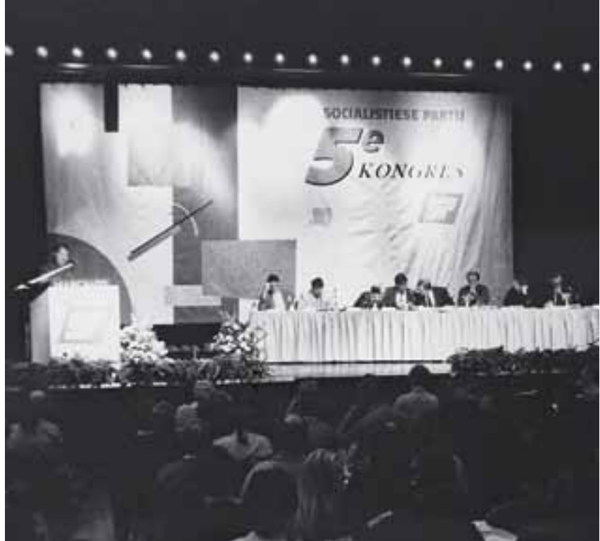
Tijdens het 5 e congres in 1991 zet de SP belangrijke stappen richting een volkspartij.

dend gevoerd had – tegen milieuvuiling en woningnood, voor een betere gezondheidszorg, tegen Amerikaanse militaire interventies, tegen het in Engeland aan de macht gekomen Thatcherisme, voor steun aan de strijd tegen de Zuid-Afrikaanse apartheid – ten spijt.