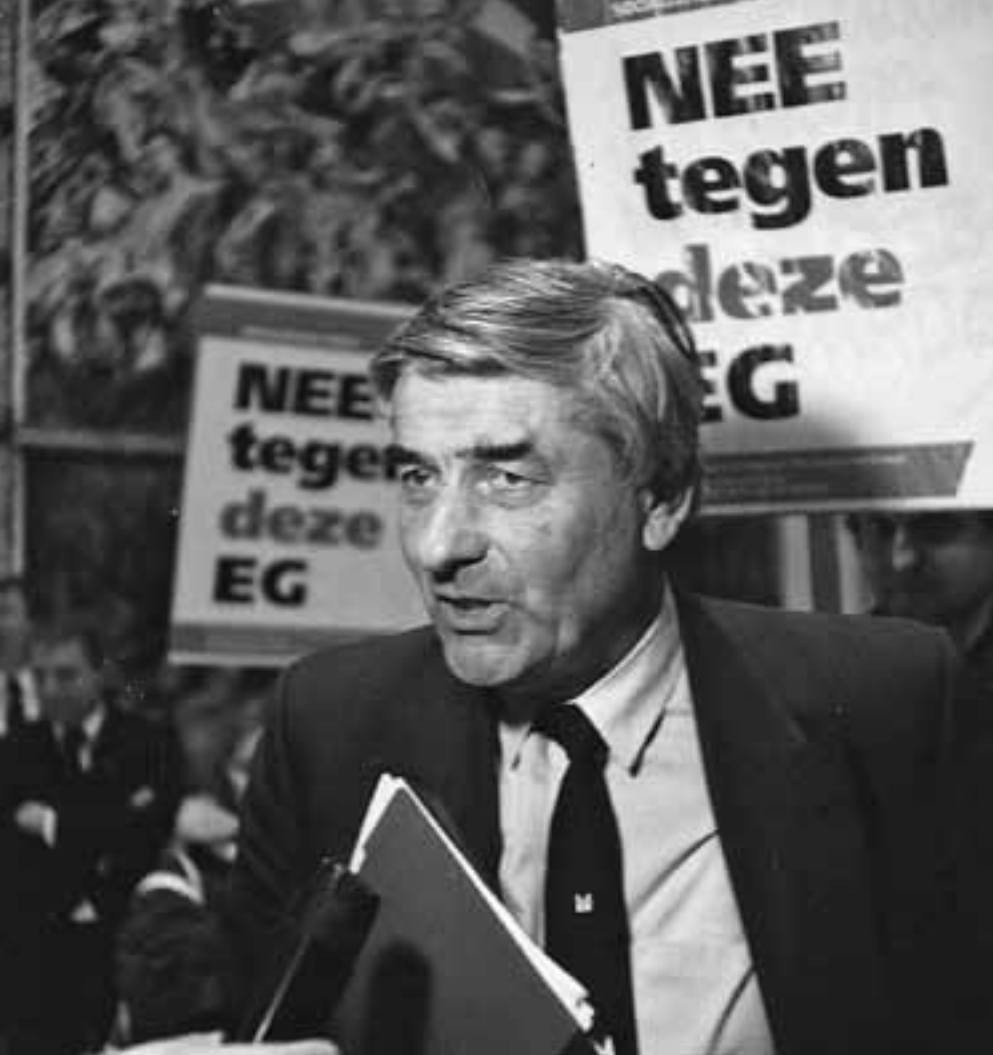
SP-actie 'Referendum Nu' tijdens het EG-debat op 12 oktober 1992.