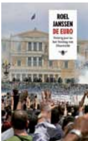
De Euro. Twintig jaar na het Verdrag van Maastricht.

Met zijn boek biedt Janssen een interessant kijkje in de keuken. De politieke hoofdrolspelers van destijds wassen hun handen voor een groot deel in onschuld. Zij zien in verdere integratie de oplossing voor de huidige problemen. En daarmee trappen ze in vrijwel dezelfde valkuil als destijds. Voor de sprong naar voren, die in 1991 niet lukte, is ook nu geen draagvlak, zeker niet onder de burgers van de huidige Unie.