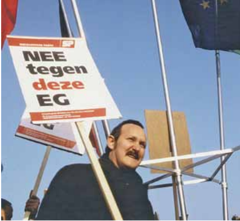
SP-actie tijdens de Eurotop in Maastricht, 9 december 1991

verwerpelijk. Het socialisme stelt de mens centraal, alle mensen. Een maatschappij naar socialistisch model moet de voorwaarden scheppen waaronder de mens, met inachtneming van zijn eigen verantwoordelijkheid, met maximale kans op succes zijn geluk kan zoeken. De voorwaarden die het socialisme naar ons inzicht tot stand moeten brengen, gaan uit van de menselijke waardigheid, de gelijkwaardigheid van mensen en solidariteit tussen de mensen. Dit zijn voor ons essentiële begrippen. Zij geven aan dat wij in alles de mens centraal stellen, hem beschouwen als norm voor alle dingen, en dat wij beseffen dat de mens een sociaal wezen is.'