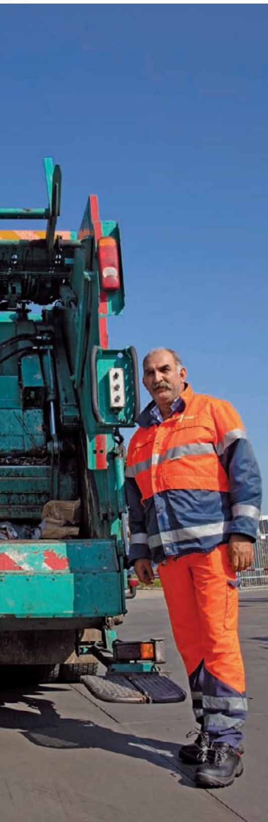
ook actief in de SP.

een meerderheid voor de verzelfstandiging van het stedelijk beheer, maar met steun van D66 is het de SP tijdens de coalitieonderhandelingen vorig jaar gelukt om de stemming te kantelen. Theeuwen: 'Als we binnen een jaar aan konden tonen dat de dienst zelf een even grote besparing kon halen als op papier stond, zou de verzelfstandiging niet