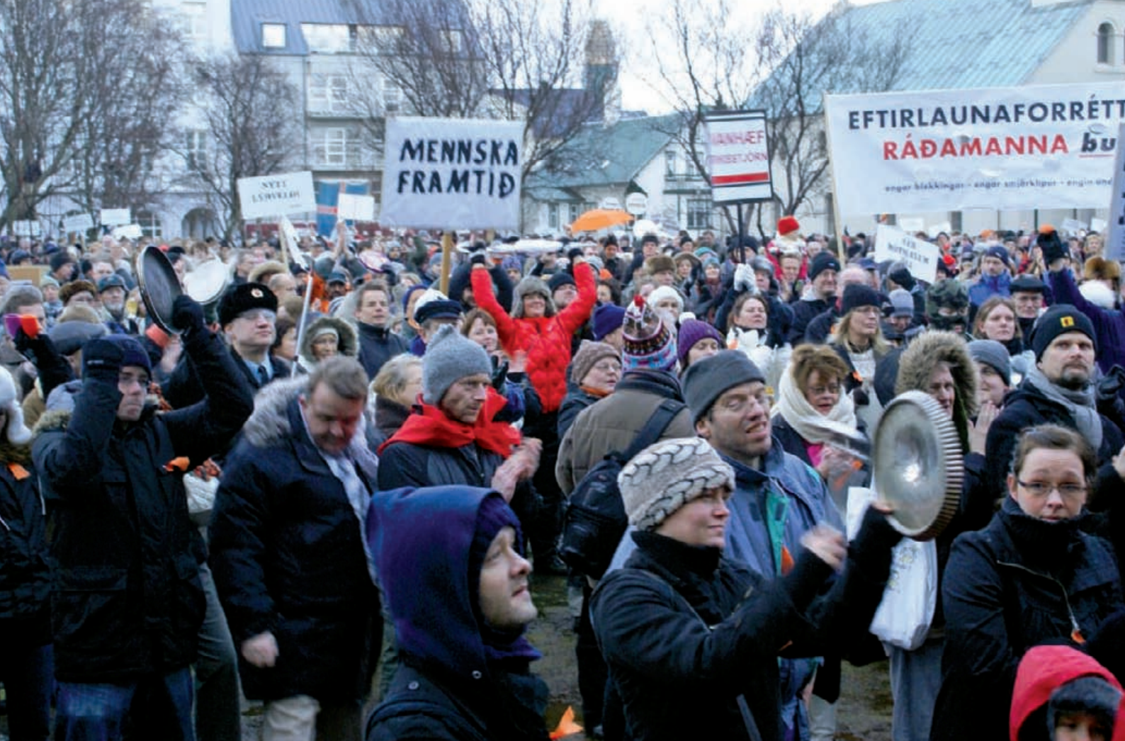
De potten- en pannenrevolutie, januari 2009.