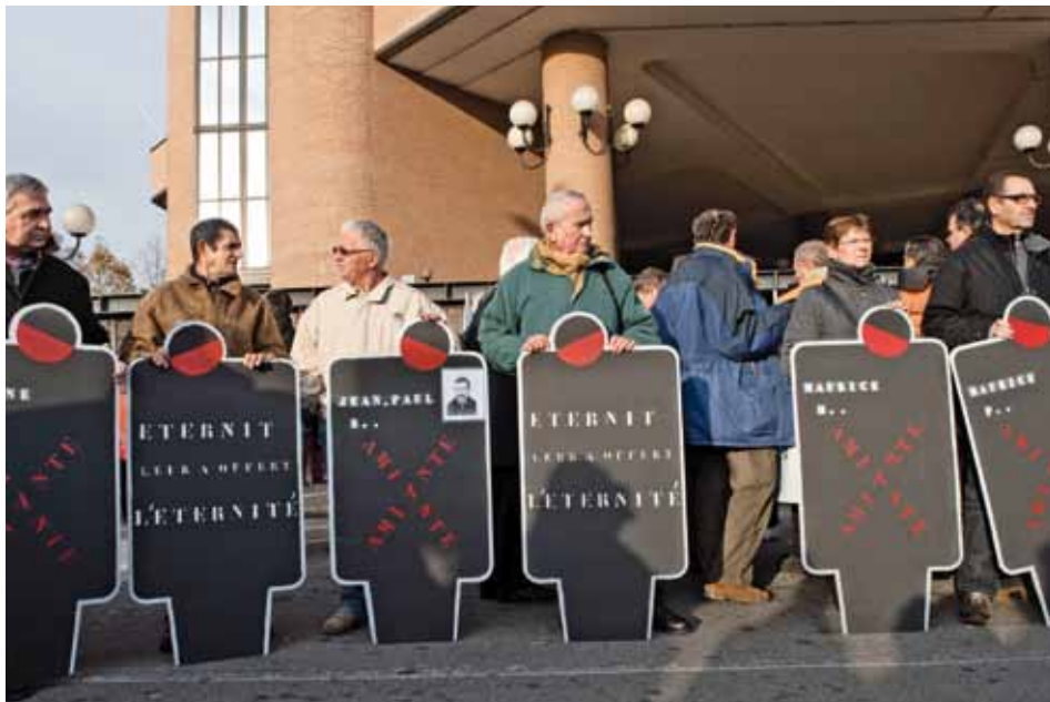
Franse actievoerders tonen solidariteit tijdens het Eternit-proces in Turijn.

In het Italiaanse proces tegen Etex, de Italiaanse divisie van asbestmultinational Eternit, is twintig jaar gevangenisstraf geëist tegen de eigenaren van het concern. Volgens de officier van justitie waren zij op de hoogte van de gevaren van asbest, maar vertikten ze het om veiligheidsmaatregelen te treffen voor de werknemers.