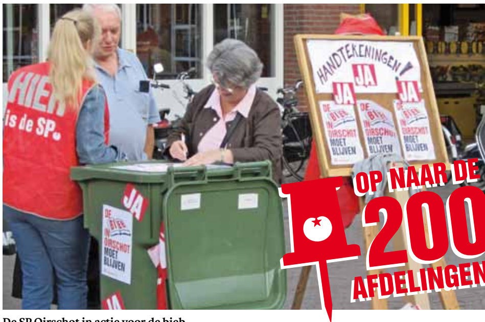
De SP Oirschot in actie voor de bie.