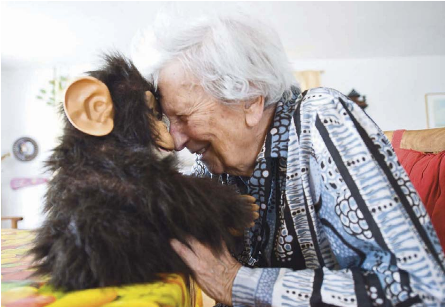
Proef bij Zorggroep Osira: Knuffelrobots ter vervanging van menselijk gezelschap?