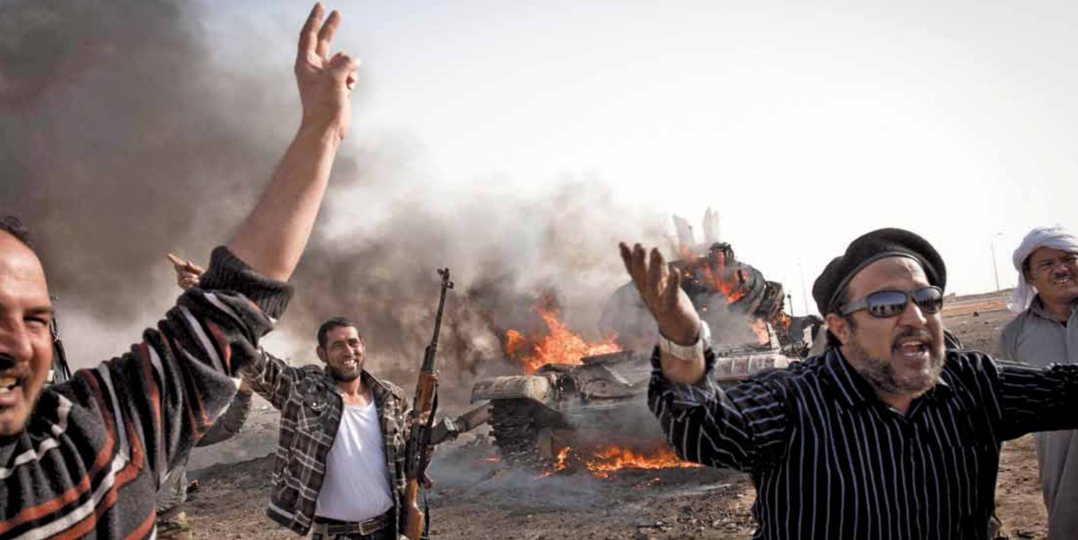
Rebellen in Ajdabiya juichen eind maart bij een verwoeste tank van Khaddafi-aanhangers.