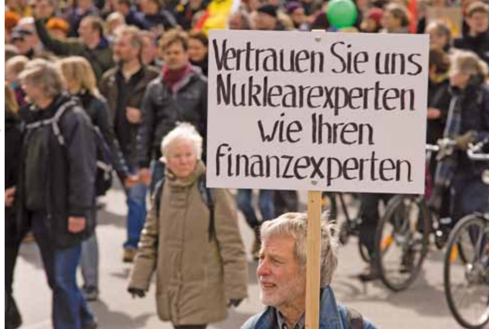
'Vertrouw ons, nucleair experts, zoals u financieel experts vertrouwt'