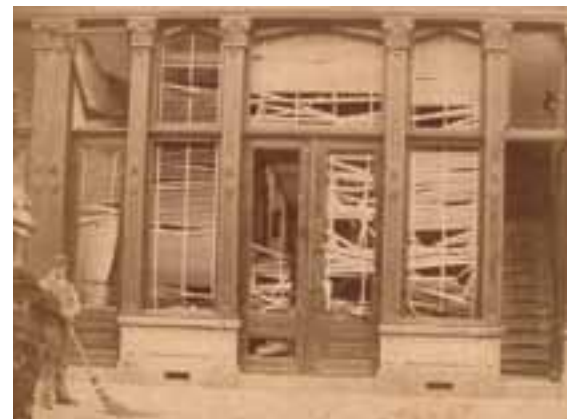
Vergaderlokaal in Rotterdam na een socialistische bijeenkomst

Dergelijke gebeurtenissen verhitten de socialistische gemoederen enorm en het was niet voor niets dat de brochure “Uit het leven van Koning Gorilla”, die een kennelijk getrouw