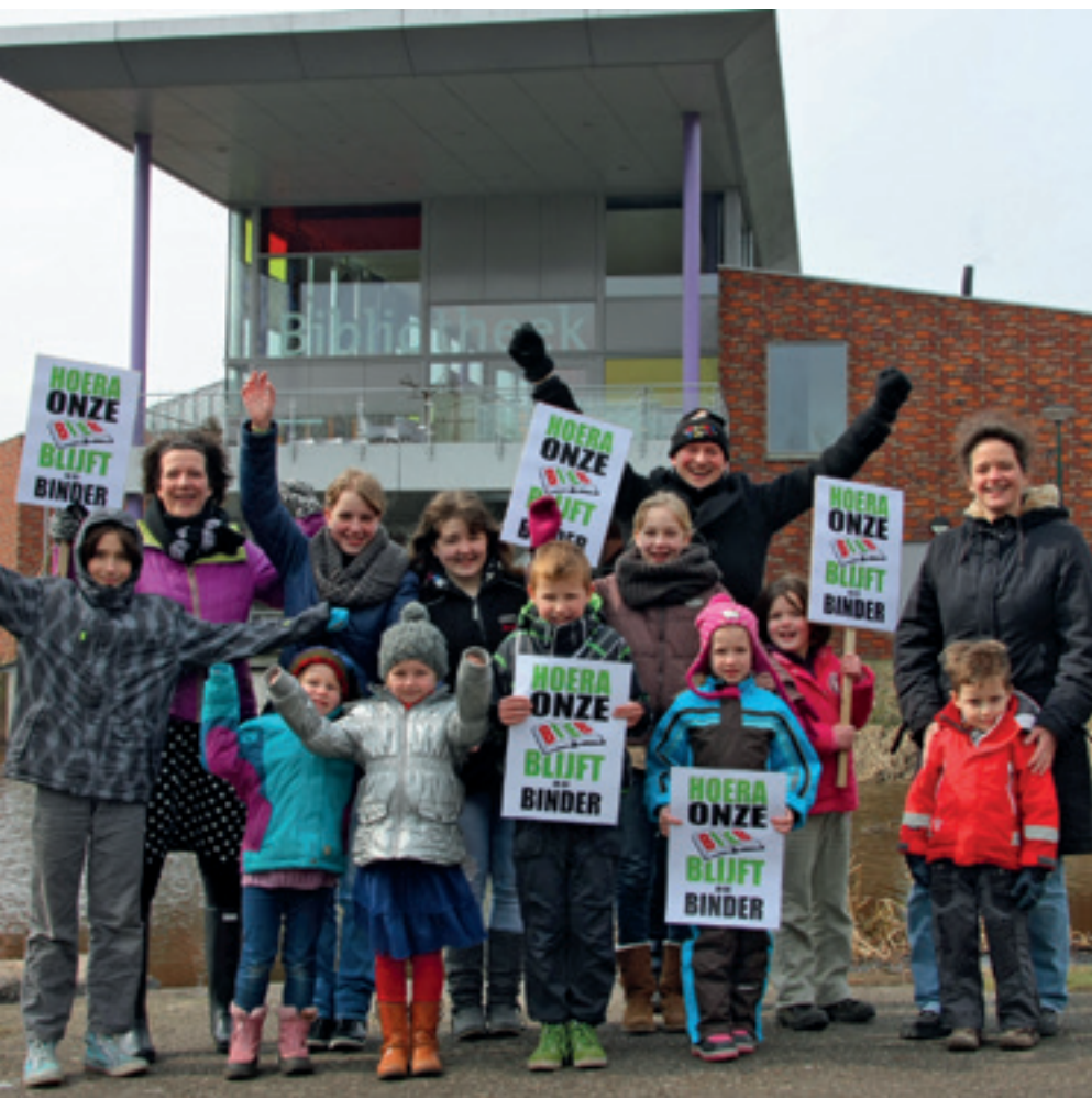
In 2013 voerde de bewoners van Leersum en de SP een jaar lang actie. Ze hebben gewonnen: de bibliotheek in Leersum blijft behouden.

klasse (gedefinieerd naar opleidingsniveau) in ernstige onzekerheid. Wanneer je uitgaat van de hele werkende klasse, is het beeld nog minder rooskleurig. Kennisinstituut Movisie schat dat 1,4 miljoen Nederlandse huishoudens risicovol schulden heeft, dat is bijna 1 op de 5. Voor een deel bestaan deze huishoudens uit personen met ernstige financiële problemen. Inmiddels zijn dat 760.000 mensen. Jaarlijks neemt deze groep met nog eens 6 procent toe. Tussen 2008 en 2013 is het aantal huishoudens in de schuldhulpverlening verdubbeld: van 44.100 naar 89.000. Het aantal dak- en thuislozen is in korte tijd opgelopen tot 31.000. Velen vinden onderdak bij vrienden en familie, maar ook slapen steeds meer mensen 's nachts op straat.