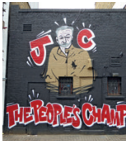
Jeremy Corbyn: kampioen van het volk.

delijk worden gesteld voor hun daden. En nu is het tijd dat we een nieuw model van economisch bestuur ontwikkelen dat de mislukte dogma's van het neoliberalisme moet vervangen... Daarom wil Labour niet alleen de schade herstellen die is ontstaan door 'austerity' (bezuinigingsbeleid) maar ook de economie veranderen door een nieuwe en dynamische rol voor de publieke sector, vooral daar waar de private sector duidelijk heeft gefaald. Daarom zijn wij vastbesloten