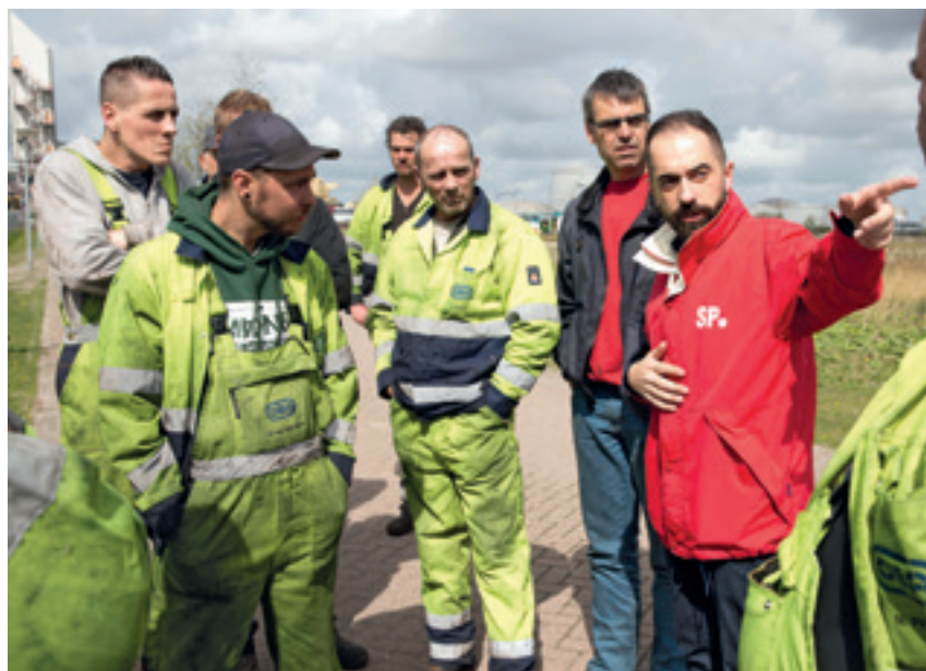
SP-Tweede Kamerlid Cem Lacin spreekt met havenwerkers bij de Hemwegcentrale in Amsterdam.