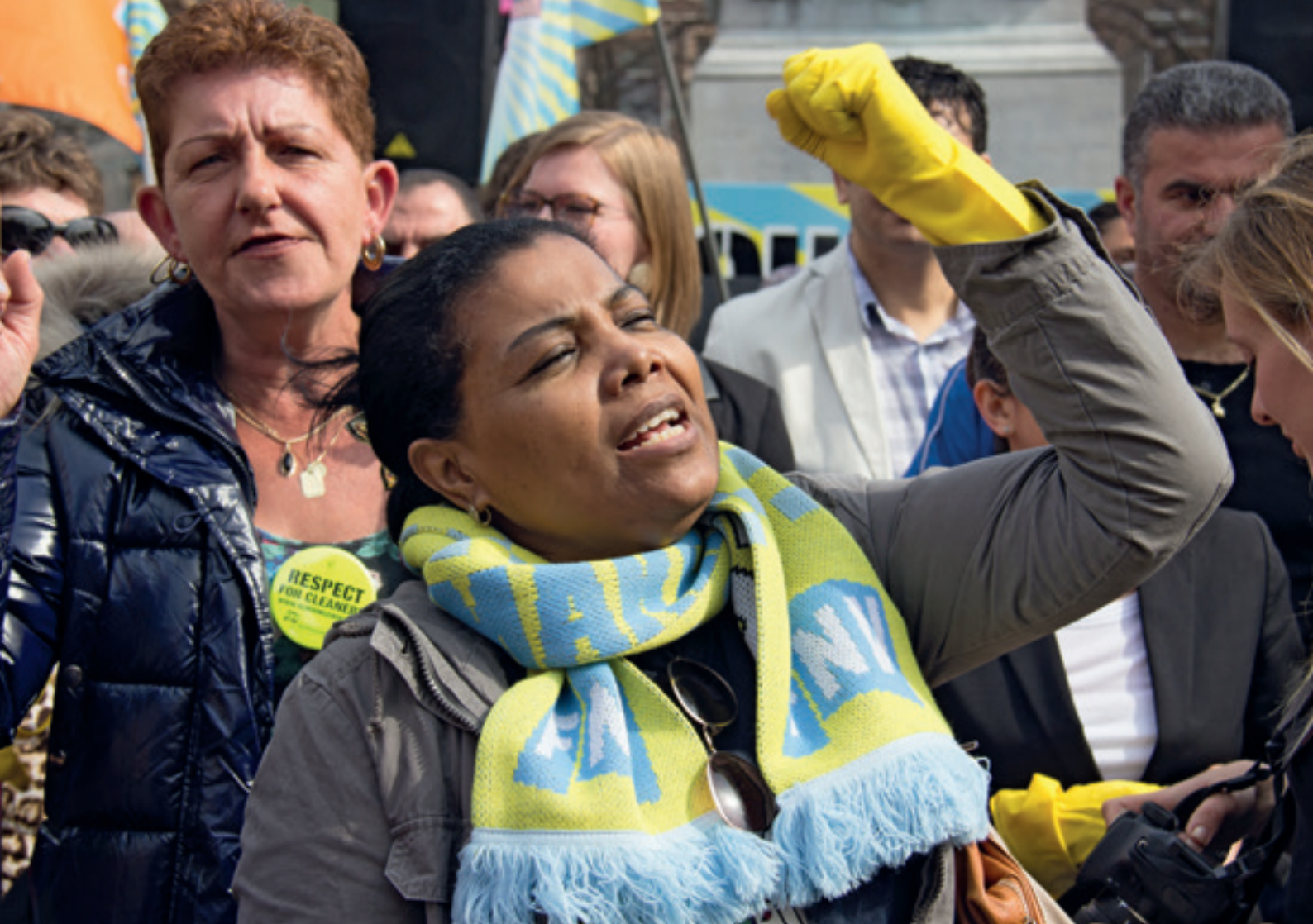
Schoonmakers verenigen zich in de strijd voor betere arbeidsvoorwaarden en meer respect.

bakken? Solidariteit werd binnen die denktrant verminkt tot ‘hulp aan zielenpieten’.