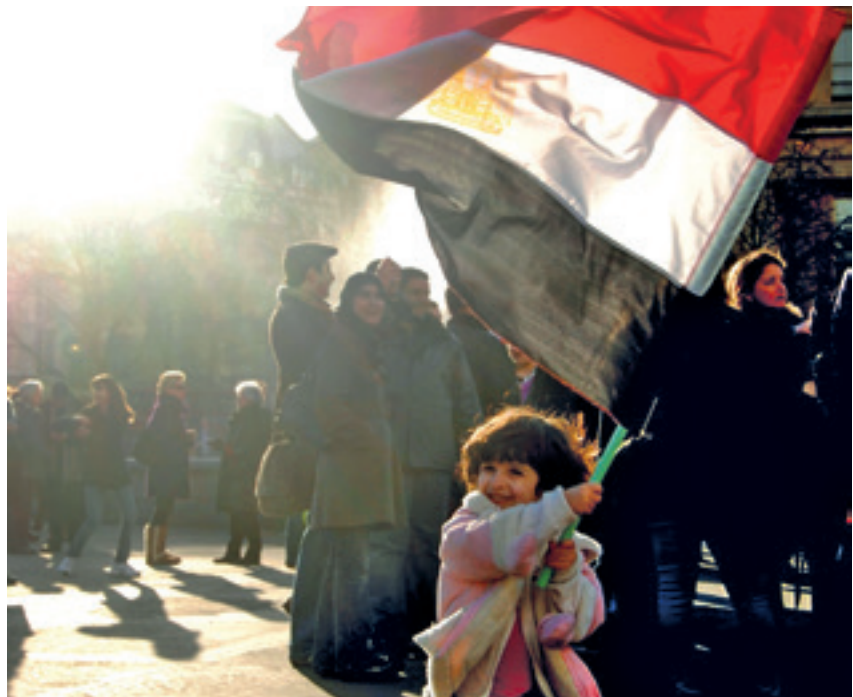
Solidariteitsdemonstratie in Londen met de opstanden in de Arabische Wereld in 2011.

Wie de Arabische Lente vanuit sociale media verklaart, zou bijna denken dat er voor Facebook en Twitter geen revoluties mogelijk waren, zelfs geen