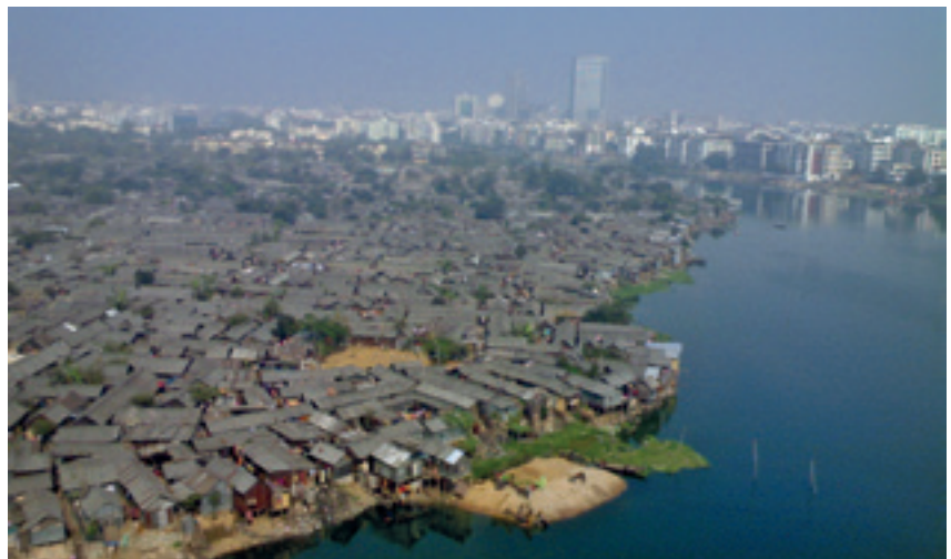
Gescheiden werelden in Dhaka, de hoofdstad van Bangladesh.

Zo remt ongelijkheid niet alleen de economische groei, maar breekt het ook een gemeenschap af. Dit jaar nog voegde een club van het formaat Internationaal Monetair Fonds zich bij het koor aan wetenschappers en instellingen met steeds dezelfde redenering: meer ongelijkheid leidt tot minder vertrouwen, en minder vertrouwen leidt, kort gezegd, tot meer ellende.