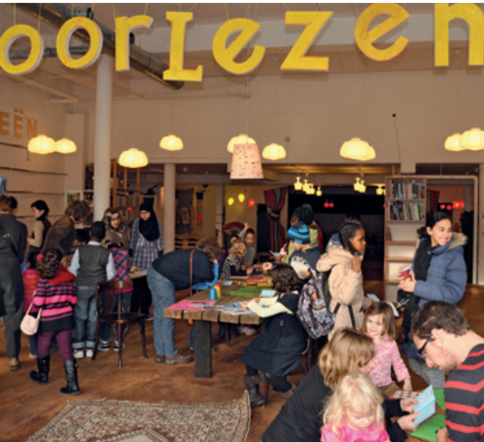
De Leeszaal is een toegankelijke plek, waar mensen binnen kunnen lopen en elkaar toevallig tegen kunnen komen.

nen. Daarbij zijn we een publieke ruimte, dus soms komen er mensen die lastig zijn. Een enkele keer moeten we zelfs iemand de deur wijzen. De relatie tussen vrijwilligersorganisaties en zorginstanties is helaas moeizaam, waardoor je problemen met individuen die overlast veroorzaken of bedreigend zijn steeds zelf moet oplossen.'