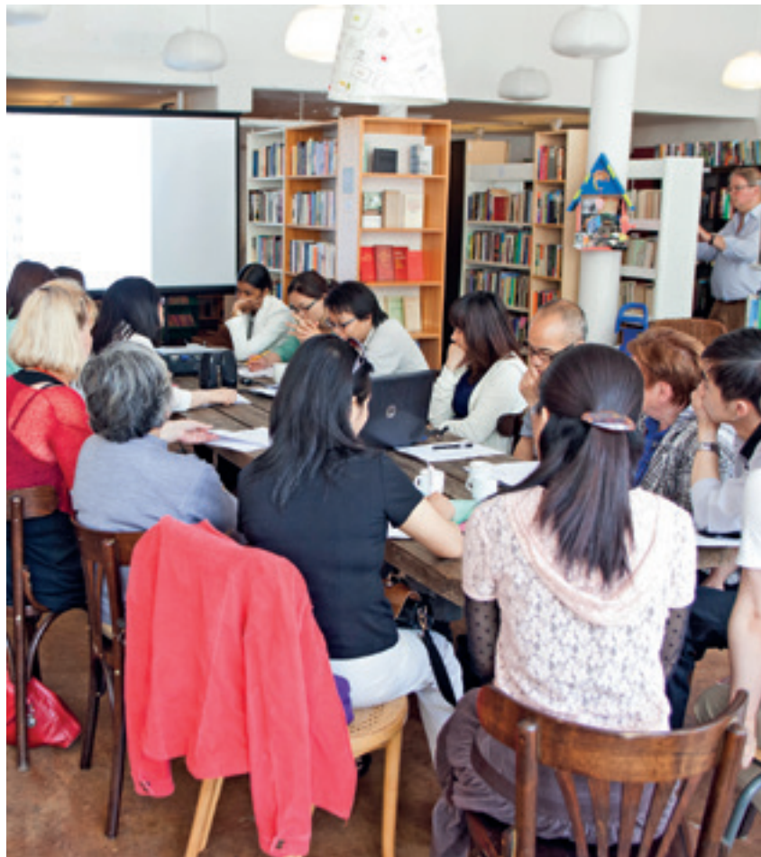
Een bijeenkomst in de Leeszaal Rotterdam West.

'Ik heb samen met een collega onderzoek gedaan naar buurthuizen in Amsterdam, zowel naar succesvolle als naar minder succesvolle voorbeelden. We zagen daarbij consequent twee dingen tegelijkertijd gebeuren. Aan de ene kant dat de overheid minder middelen beschikbaar stelde en meer eigen verantwoordelijkheid eiste van buurthuizen. Aan de andere kant dat diezelfde overheid juist meer voorwaarden ging stellen voor het verkrijgen van middelen. Die combinatie van 'jij moet meer dingen doen en ik ga je specifiek vertellen wat jij gaat doen' werkt heel ontmoedigend. Als jij als overheid meer eigen initiatief van mensen verlangt, moet je wel zorgen voor een goede infrastructuur, zodat burgerinitiatieven tot volle wasdom kunnen komen. Je zou dus een gebouw beschikbaar moeten stellen en enige vorm van professionele begeleiding. Daar ontbreekt het nu vaak aan.'