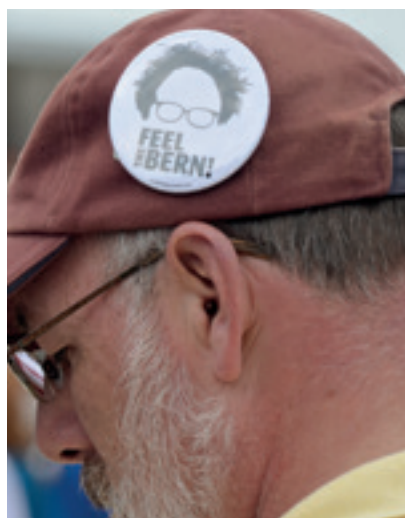
Een aanhanger van Bernie Sanders tijdens een verkiezingsbijeenkomst.

Denk aan de burgerrechtenstrijd. Miljoenen mensen kwamen samen en zeiden: wij gaan een eind maken aan segregatie en racisme in Amerika. Denk aan de vrouwen die samen optrokken en zeiden: wij accepteren het niet meer om als tweederangsburgers te worden behandeld. Denk aan de milieubeweging die zich verenigde en zei: we moeten in actie komen tegen de klimaatcrisis. Denk aan de