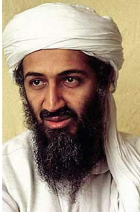
Osama Bin Laden.

Doelstelling van de operatie, die achteraf door de Veiligheidsraad zou worden goedgekeurd, was het opsporen van Osama bin Laden. In de jaren '80 was hij ooit in Afghanistan bondgenoot van de Amerikanen, ten tijde van de Russische bezetting van dat land. Nu werd hij gezien als de vermoedelijke opdrachtgever van de aanval van 11 september en andere recente aanslagen op Amerikaanse ambassades en militaire objecten. Deze missie, 'Operation Enduring Freedom' geheten, was grotendeels Amerikaans. Een paar NAVO-bondgenoten deden mee met kleine eliteonderdelen, maar